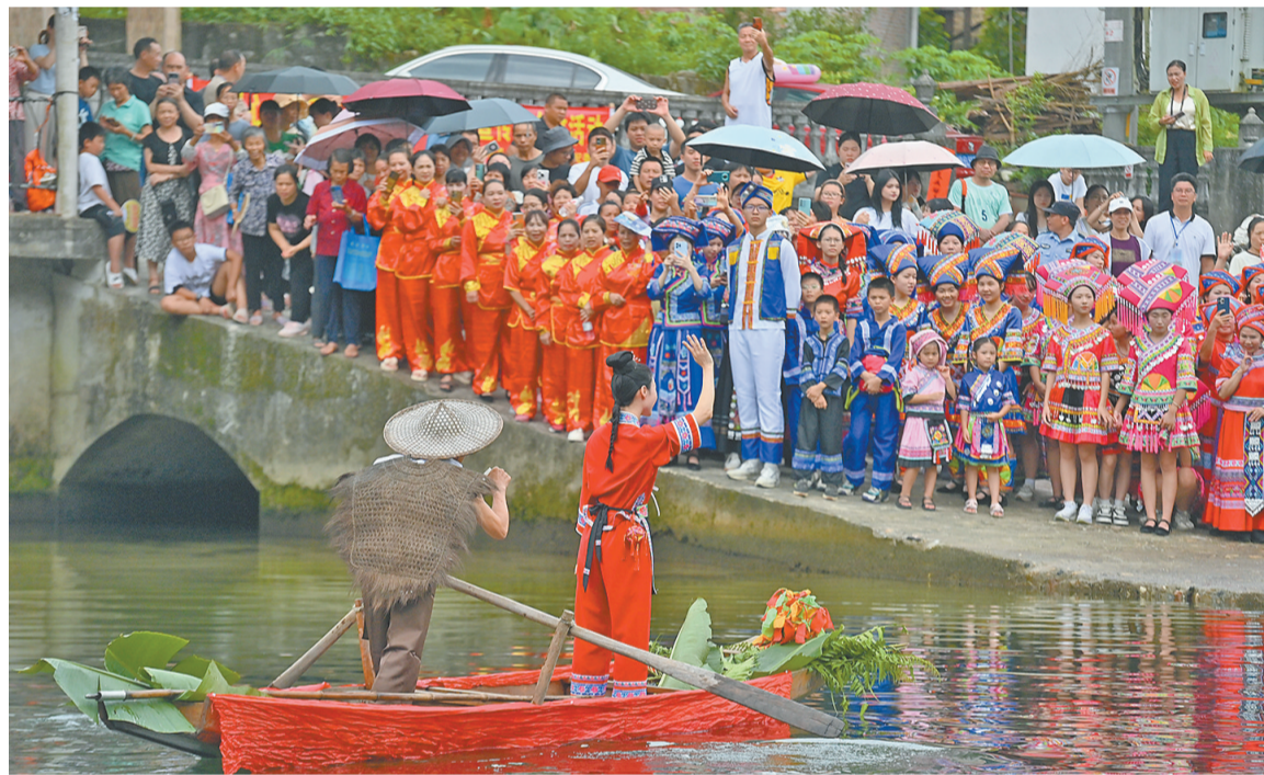
近日，在柳州市融水苗族自治县汪洞乡，村民们在改造后的河道上进行“刘三姐河上实景演出”。近年来，广西柳州市融水苗族自治县汪洞乡在结对帮扶的广东省廉江市相关部门的支持下，充分利用水资源丰富的优势，举办水上竞技比赛、山歌对唱活动、非遗文化进校园等，擦亮“水文化”品牌，推进民族文化旅游产业发展，助力乡村振兴。

欢迎大家有空来中国，中国始终向大家敞开着大门。这是一份发向世界的邀请。 据新华社