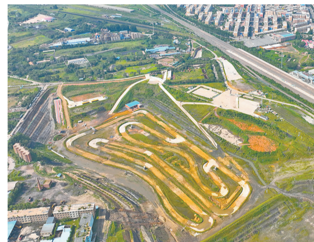
这是日前拍摄的阜新百年国际赛道。近年来，辽宁因地制宜，实施多种方案加强生态环境治理，加快推进矿山矿坑综合修复。在阜新市新邱区，曾经废弃的矿坑经过几年的生态修复和综合治理，改造成为汽车摩托车运动赛场，建设了阜新百年国际赛道。如今，这里举办了多场文体活动，开创了消费新业态，展现了新活力。

“总体来看，此次发布的公告不是一项新出台的税收政策，而是现行政策的延续、细化和完善，有助于更好推动彩票事业发展、更好发挥彩票在社会公益事业发展中的重要作用。”施正文说。 据新华社