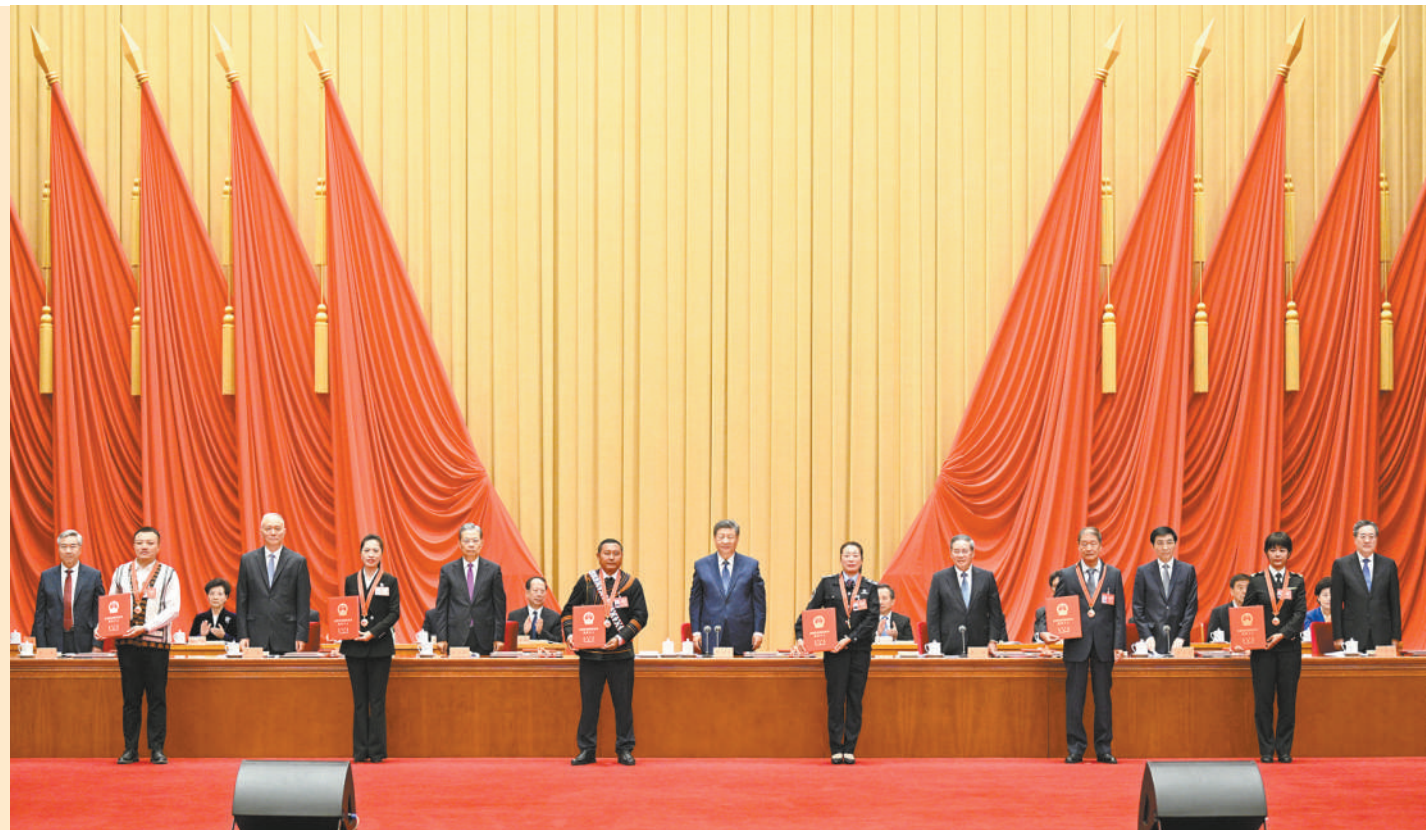
9月27日，全国民族团结进步表彰大会在北京举行。这是习近平等为受表彰的模范个人和模范集体代表颁奖。

新华社北京9月27日电 全国民族团结进步表彰大会27日上午在北京举行。中共中央总书记、国家主席、中央军委主席习近平出席大会并发表重要讲话。他强调，要全面贯彻新时代中国特色社会主义思想特别是党关于加强和改进民族工作的重要思想，坚持以铸牢中华民族共同体意识为主线，不断推进民族团结进步事业，推动新时代党的民族工作高质量发展，推进中华民族共同体建设，为以中国式现代化全面推进强国建设、民族复兴伟业而不懈奋斗。 李强主持大会，王沪宁宣读表彰决定，赵乐际、蔡奇、丁薛祥、李希出席。