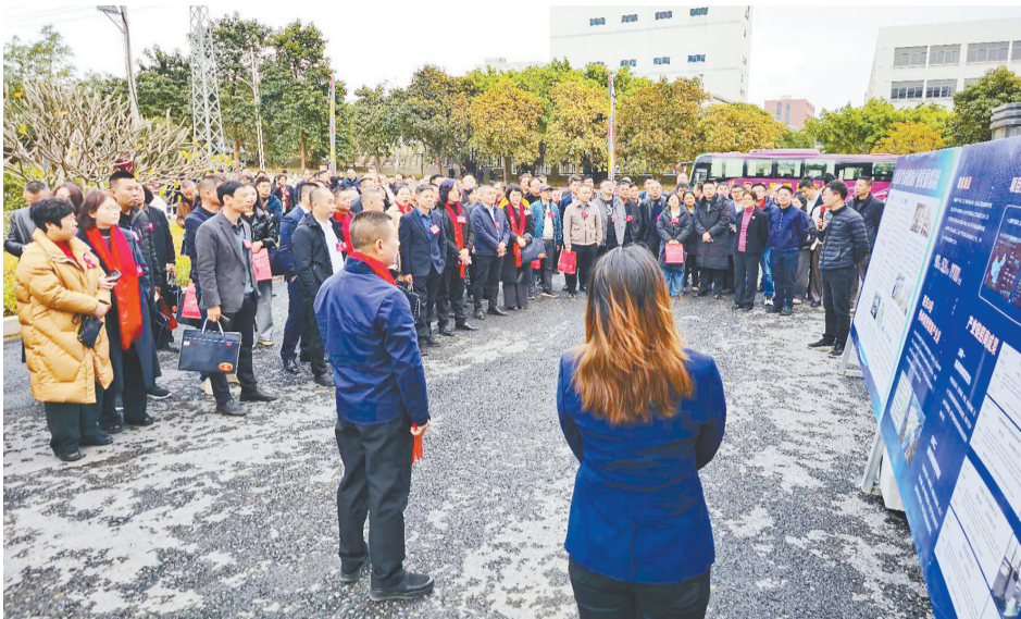
区政协组织政协委员前往笏石工业园区开展集中视察活动。