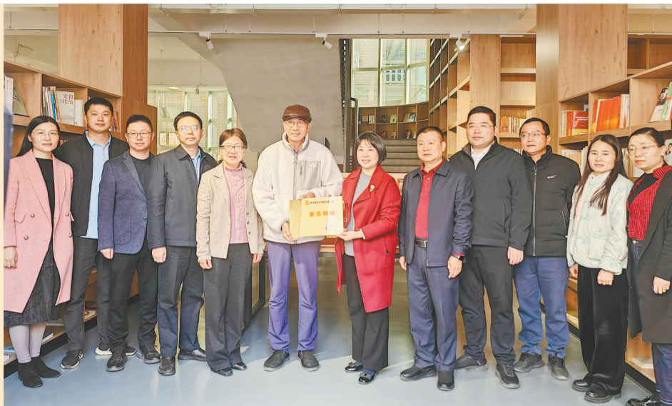
区政协在东庄镇坐忘图书馆举行“委员驿站”授牌仪式。

秀屿区持续深化拓展“三争”行动，落实“一五二三四”工作部署，聚焦产业提质广谋善举，聚焦民生民情广纳民意，推动建言资政和凝聚共识并驾齐驱，为助力“五区”建设履职尽责。