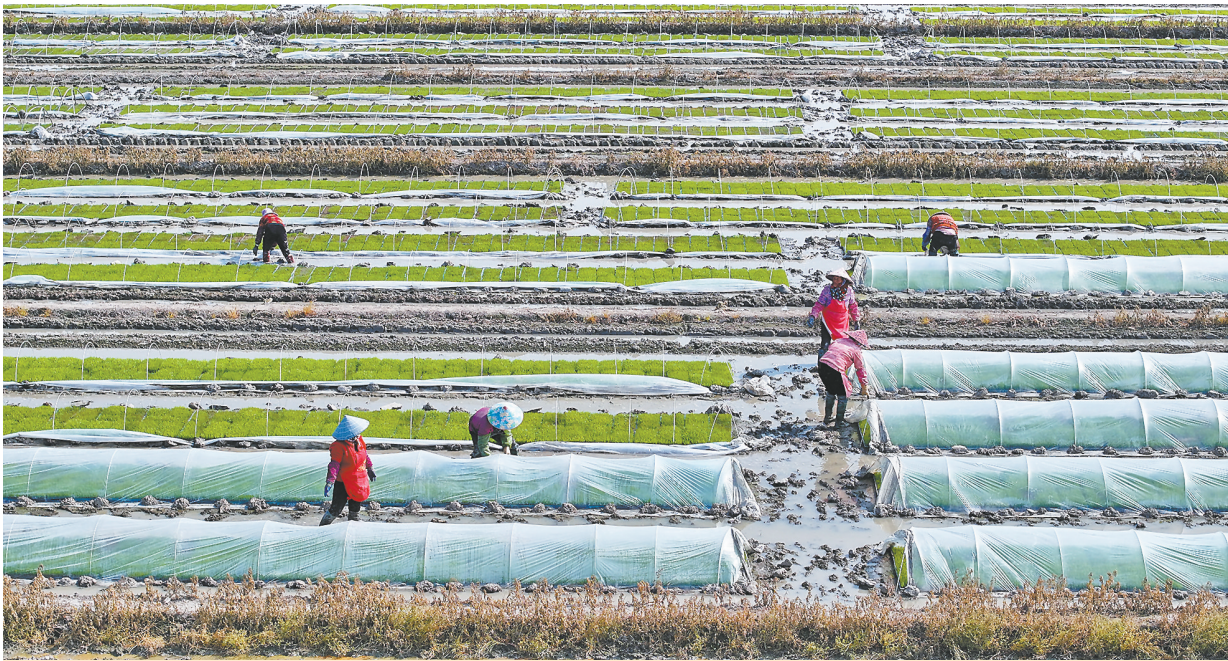
图为黄石镇金山村农户在田间忙着育秧。

本报讯 春耕春播迎来“黄金期”,为保障农业生产安全、高效推进,城厢区农业农村局组织农业机械化发展中心全面开展农机安全隐患排查、机具检修技术指导以及安全宣传教育等工作,为春耕春播保驾护航。 执法人员深入灵川、东海等重点农业区域,对农机合作社、维修网点及农机户开展地毯式排查,重点聚焦违规维修已报废农机、无牌套牌农机等问题,仔细核查农机手的驾驶证持有情况等。在农机具保养与调试环节,执法人员现场为农机手提供专业指导,确保每台农机具都能以最佳状态投入春耕。 在排查过程中,执法人员还开展政策宣传与答疑工作,向农机手发放农机安全宣传资料,解读农机购置补贴、报废更新补贴等惠民政策,讲解农机安全操作规范与注意事项。 针对部分农机具存在安全隐患、农机手证照过期等情况,执法人员严格履行职责,当场提出整改意见,明确整改期限,确保“隐患不除,机具不动”,从根源上防范农机安全事故的发生。 据介绍,城厢区农业农村局将持续强化农机安全隐患排查、机具检修和技术指导工作,充分发挥农业机械在春耕春播中的重要作用。(陈丽君 许晨昕)