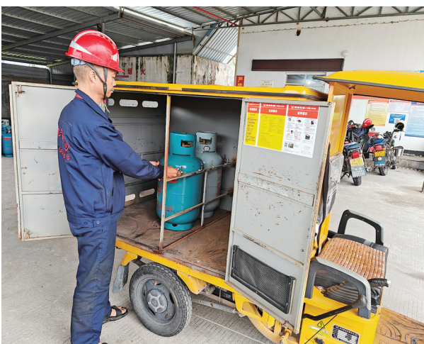
图为送气工对专用车辆上的气瓶进行固定。

记者从市燃气管理处获悉，我市瓶装液化气经营企业经过整合，目前共有6家，设有近100个供应站。除了仙游试