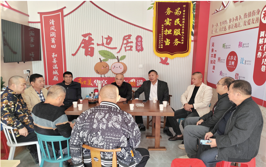
城厢区打造调解品牌，解决群众烦心事。

今年以来，城厢区围绕“存正心、守正道、养正气”主题，以“清风润莆田、和善满城厢”为载体，用政策温度、服务精度、爱心广度，让暖心成为城市最鲜明的标识。