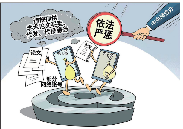
●一批涉学术论文买卖违法违规账号被严惩 咩咩 作