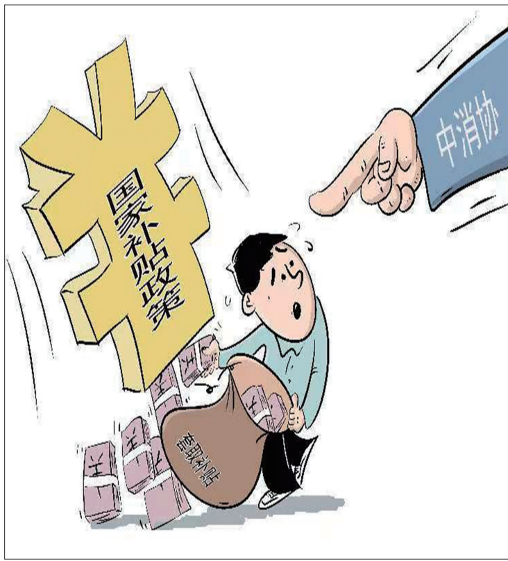
●套取补贴 徐瑞平 作