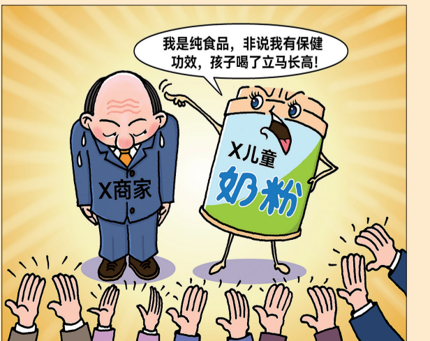
●揭底 王真 作