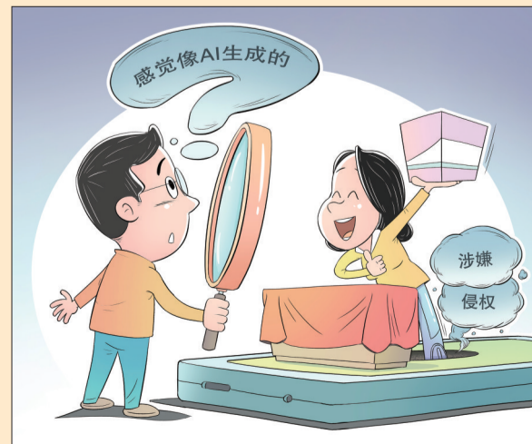
●靠谱吗？ 王琪 作