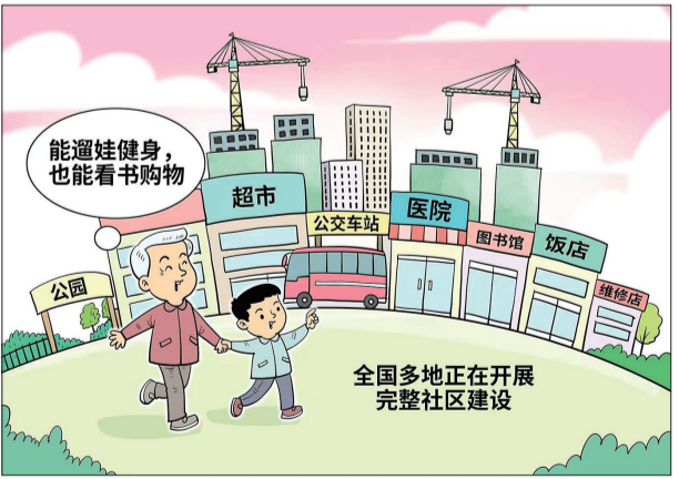
●完整社区建设 旦亭 作