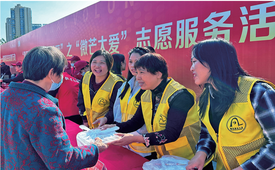
城厢区志愿服务活动现场。