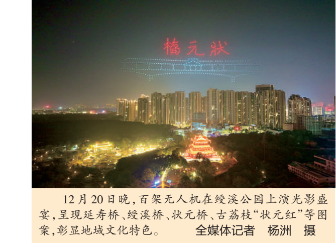
12月20日晚,百架无人机在绶溪公园上演光影盛宴,呈现延寿桥、绶溪桥、状元桥、古荔枝“状元红”等图案,彰显地域文化特色。

本报讯（全媒体记者 傅梅香）12月19日,市政协党组理论学习中心组学习研讨会召开,围绕“深入学习贯彻省政协党组理论溯源文章《传承弘扬习近平同志在福建工作期间关于人民政协工作的重要理念和重大实践 为谱写中国式现代化福建篇章凝心聚力》,全面理解和深刻把握习近平总书记关于加强和改进人民政协工作的重要思想,为做好新时代人民政协工作夯实政治根基,打牢思想基础”主题,开展交流研讨。市政协党组书记、主席沈萌芽,党组副书记、副主席黄华,党组成员、副主席张志宏、连向红,党组成员、秘书长陈四海出席;副主席王少华、张宗贤列席。 沈萌芽强调,要在“学”上先行,进一步筑牢思想根基,把准政治方向。紧扣核心要义深学细悟,用好特色学习载体、联系实践实际,将学习习近平总书记重要论述与学习省政协党组理论溯源文章一体贯通,切实把学习成效转化为绝对政治忠诚、清晰工作思路和务实履职举措。要在“言”上用心,进一步服务中心大局,彰显履职价值。坚持精准选题建言、强化协商监督、广泛凝聚共识,紧扣市委“一五二三四”工作部署与群众急难愁盼问题深入调研献策,用好“莆事好商量”协商品牌,以高质量履职服务莆田绿色高质量发展。要在“谋”上发力,进一步加强工作谋划,夯实履职基础。系统谋划明年履职重点,健全工作机制,着力打造高素质委员和机关干部队伍,全面提升政协工作制度化规范化水平,为八届市政协圆满收官、助推莆田“十五五”发展良好开局奠定坚实基础。