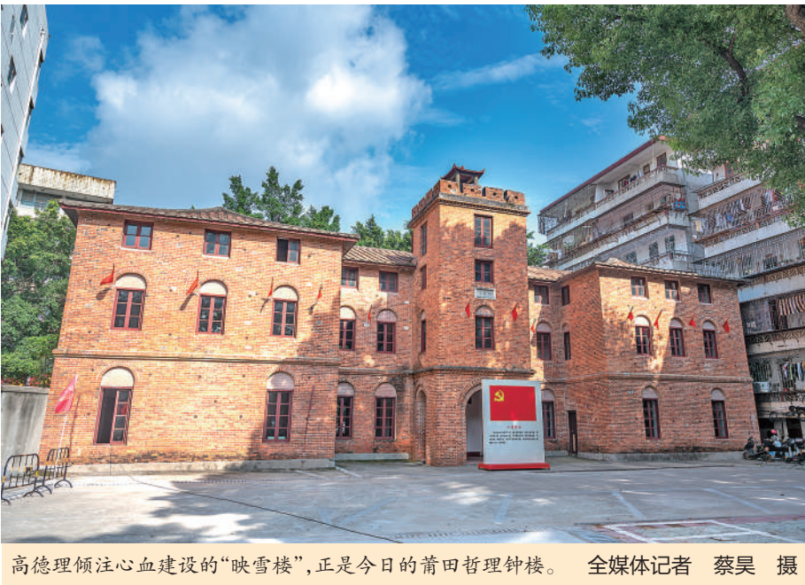
高德理倾注心血建设的“映雪楼”,正是今日的莆田哲理钟楼。

12月19日,莆田第一中学组织开展“承冬至民俗,扬中华美德”主题实践活动,实现实践育人、文化育人、劳动育人的有机融合。学生们在亲身体验搓汤圆中感受劳动价值,增强文化自信,厚植家国情怀。