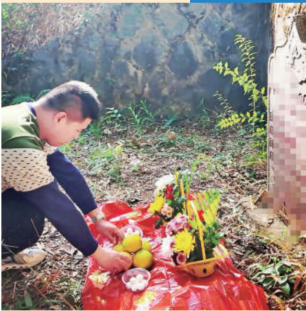
志愿者为高德理扫墓。