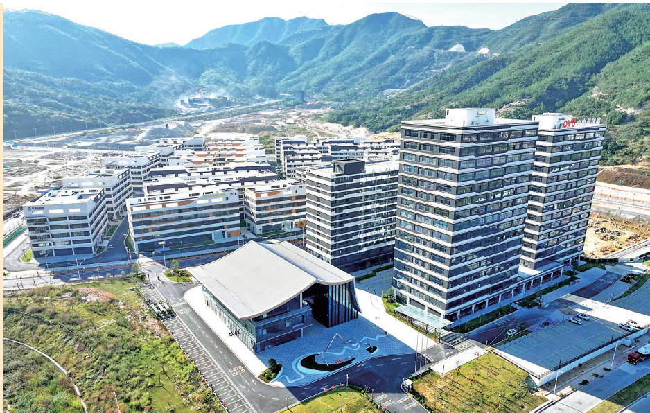
中电科创城核心区一期交付使用。

2025年,城厢区锚定“和美莆田 共同富裕”首善之区奋斗目标,以“七大行动”为总抓手,在攻坚克难中顶压前行,在真抓实干中开拓进取,交出了一份含金量十足的年度答卷。