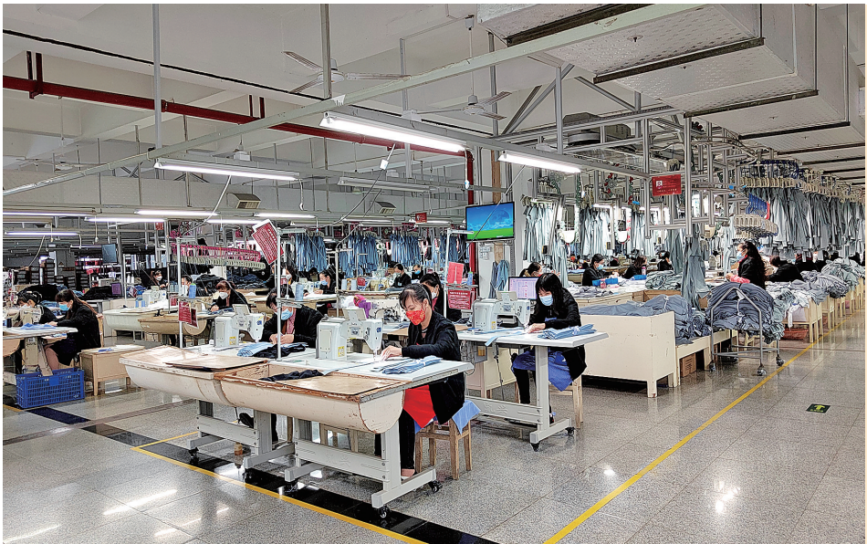
才子服饰生产车间,工人忙碌生产。