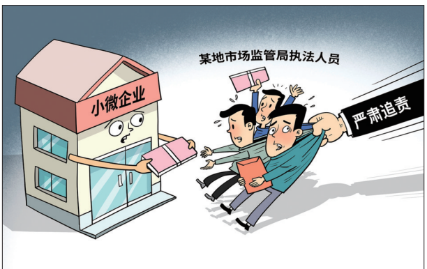
●堵住“吃拿卡要”,莫让“微权力”啃食企业利益。且亭 作