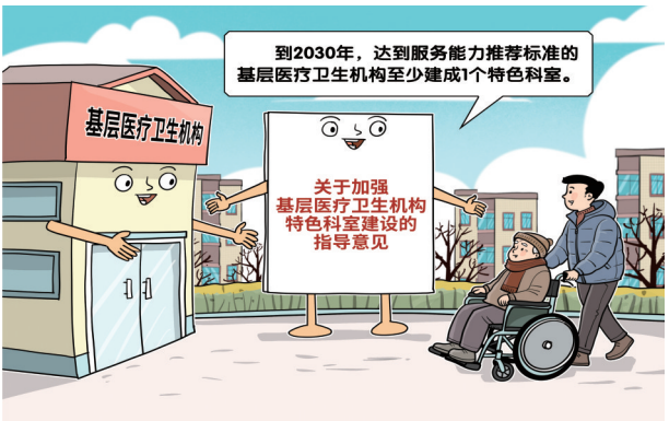
●就近就医 朱慧卿 作