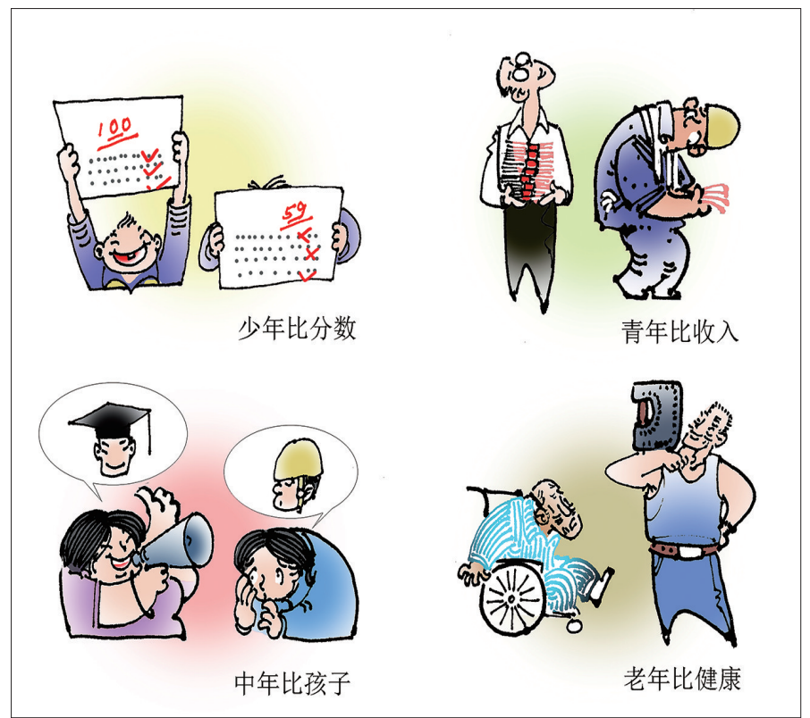
●生命不息 攀比不止 马菁海 作