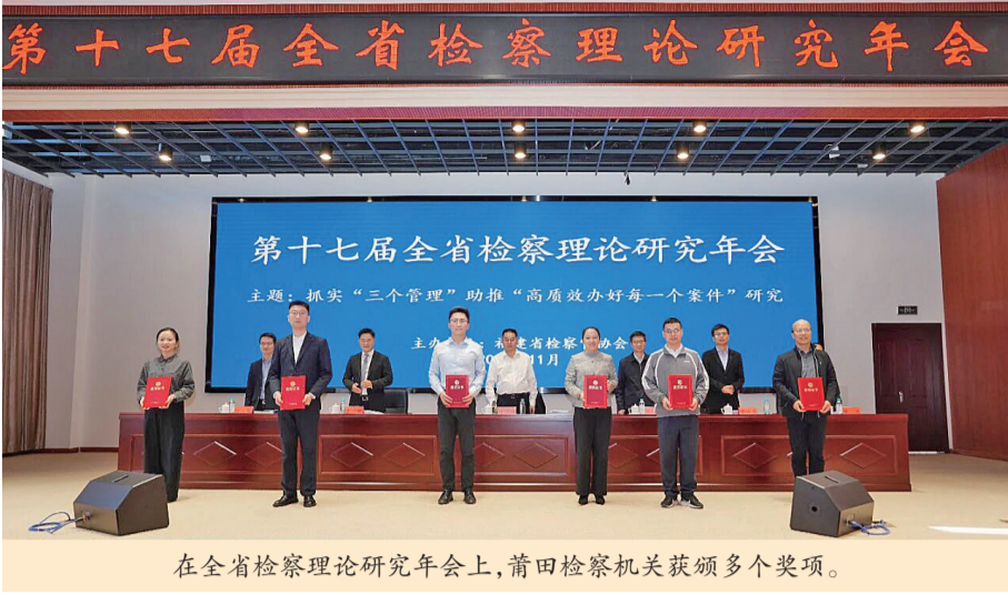
在全省检察理论研究会年会上，莆田检察机关获颁多个奖项。

S 视点 市人大常委会揭晓课题调研获奖名单，全省9篇论文获奖，其中莆田检察机关有4篇；福建省法学会2025年年会论文中莆田市中级人民法院有11篇优秀论文获奖；第五届东南法治论坛暨主题征文活动中，莆田市中级人民法院4篇论文获奖，市人民检察院获评“优秀组织单位”…… 年终，莆田检察机关理论调研工作捷报频传，交出了一份成果丰硕的年度答卷。全年95篇调研文章在省级以上平台获奖，25篇获国家级荣誉。 成果背后，是理论研究与司法实践深度融合的生动写照。 莆田检察机关始终将理论研究置于检察工作现代化全局中来谋划和推进，紧紧围绕“为大局服务、为决策服务、为实践服务”的职能定位，系统构建并持续深化队伍、智库、文化、要素“四个体系”，让理论研究不仅成为驱动履职创新的“思想引擎”，更转化为助推高质量发展的“源头活水”，走出了一条用理论之笔，答实践之题，走好研用并重、知行合一的奋进之路。 莆田检察机关将理论调研能力作为干警培养选拔的重要素能之一，精心培育兼具“笔力”与“战力”的先锋方阵。