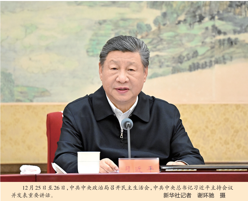
12月25日至26日，中共中央政治局召开民主生活会，中共中央总书记习近平主持会议并发表重要讲话。

新华社北京12月26日电 中共中央政治局于12月25日至26日召开民主生活会，深入学习贯彻习近平新时代中国特色社会主义思想，全面贯彻党的二十届四中全会精神，围绕锲而不舍落实中央八项规定精神，推进作风建设常态化长效化，结合思想和工作实际进行自我检视、党性分析，开展批评和自我批评。 中共中央总书记习近平主持会议并发表重要讲话。 会前，有关方面作了认真准备。中央政治局同志同有关负责同志谈心谈话，听取意见建议，撰写发言提纲。会上，先听取关于2025年中央政治局贯彻执行中央八项规定情况的报告和关于2025年整治形式主义为基层减负工作情况的报告。中央政治局的同志逐个发言，围绕会议主题，对照《中共中央政治局关于加强和维护党中央集中统一领导的若干规定》、《中共中央政治局贯彻落实中央八项规定实施细则》，认真查摆、深刻剖析，坦诚相待、畅所欲言，气氛严肃活泼，收到预期效果。 中央政治局同志的发言，聚焦5个重点。一是带头强化政治忠诚、提高政治能力，二是带头固本培元、增强党性，三是带头敬畏人民、敬畏组织、敬畏法纪，四是带头干事创业、担当作为，五是带头坚决扛起管党治党责任。 会议强调，2025年是很不平凡的一年，面对国内外形势带来的严峻挑战，以习近平同志为核心的党中央团结带领全党全国各族人民迎难而上、奋力拼搏，经济社会发展主要目标将顺利完成，“十四五”即将圆满收官。我国经济顶压前行、向新向好发展，改革开放迈出新步伐，民生保障更加有力，社会大局保持稳定。这些成绩来之不易。 中央政治局的同志一致认为，党和国家事业取得新的重大成就，根本在于以习近平同志为核心的党中央领航掌舵，在于习近平新时代中国特色社会主义思想科学指引。全党必须深刻领悟“两个确立”的决定性意义，增强“四个意识”、坚定“四个自信”、做到“两个维护”。明年是“十五五”开局之年，要坚决落实党中央决策部署，完整准确全面贯彻新发展理念，加快构建新发展格局，着力推动高质量发展，进一步全面深化改革，更好统筹发展和安全，推动经济实现质的有效提升和量