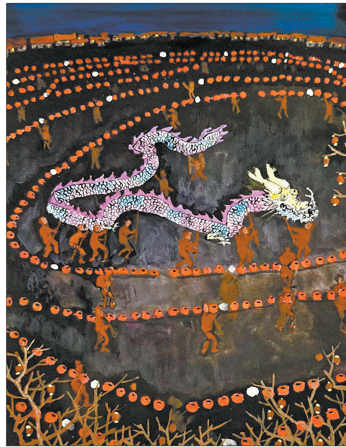
●千灯映莆兆丰年 黄云羿 作