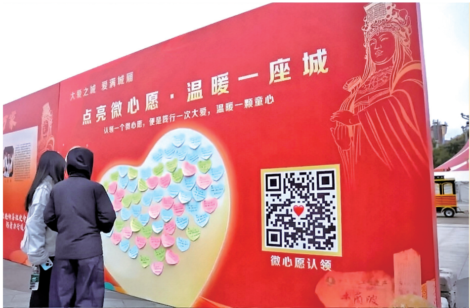
市民正在认领微心愿。