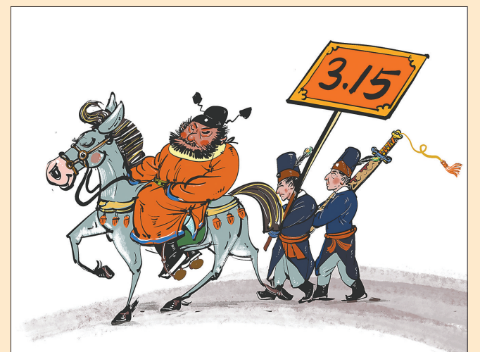
●出巡 邹磊 作