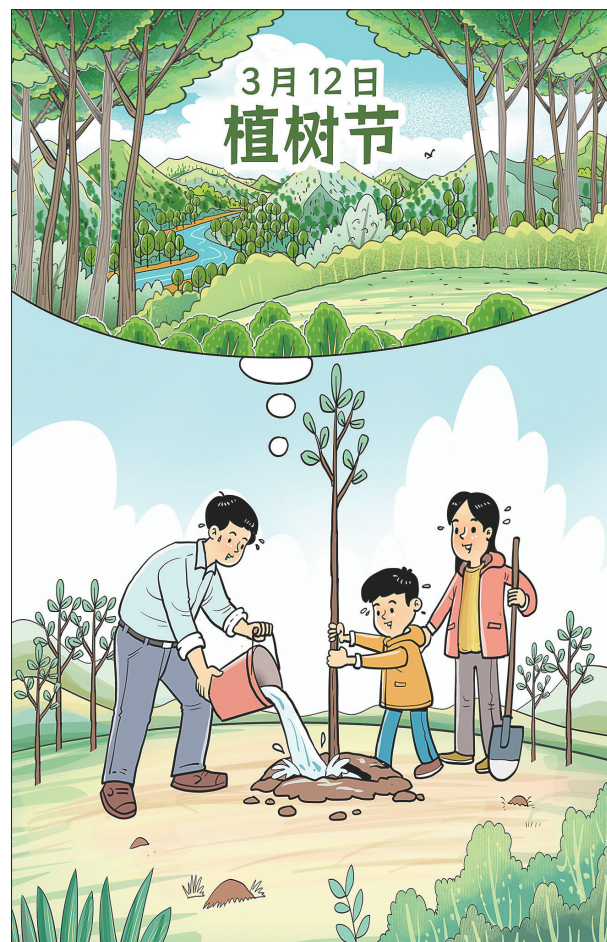
●种下绿色梦想 朱慧卿 作