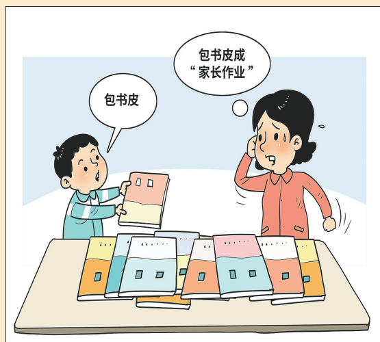
●“家长作业” 且亭 作