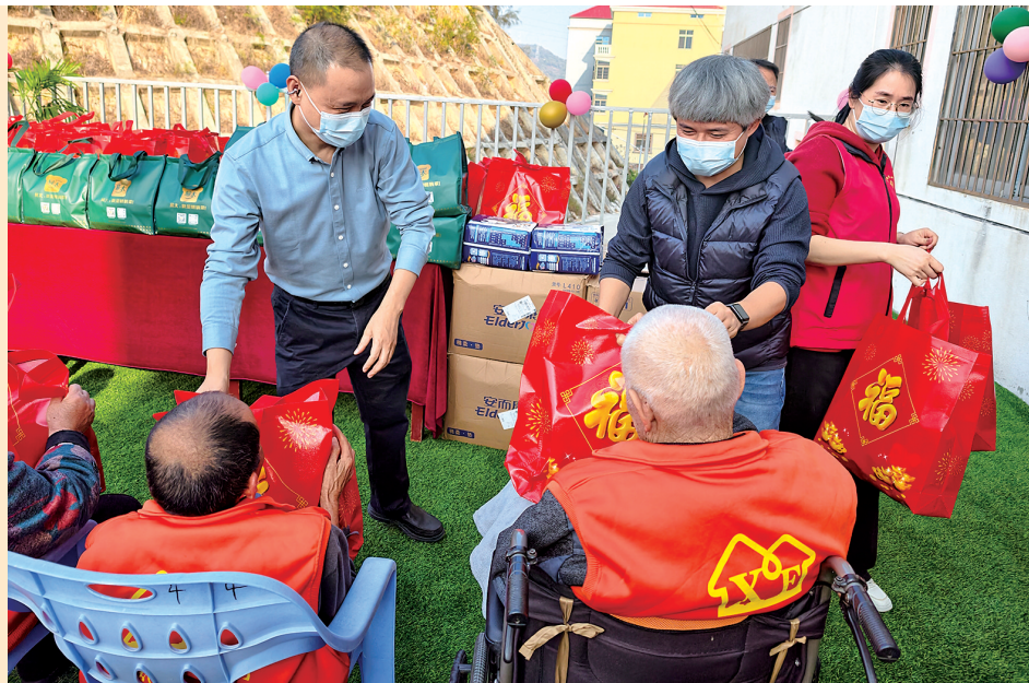
根据前期收集的心愿清单,城厢区为养老院的老人们发放新春大礼包。

城厢区联动多部门、汇聚全社会力量,让爱心从日常温暖升级为制度实践,将微小善意汇聚成全城大爱,共筑“爱之城”。