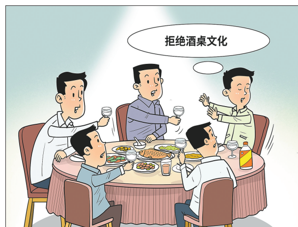
●“年轻人拒绝酒桌文化是社会进步” 咩咩 作