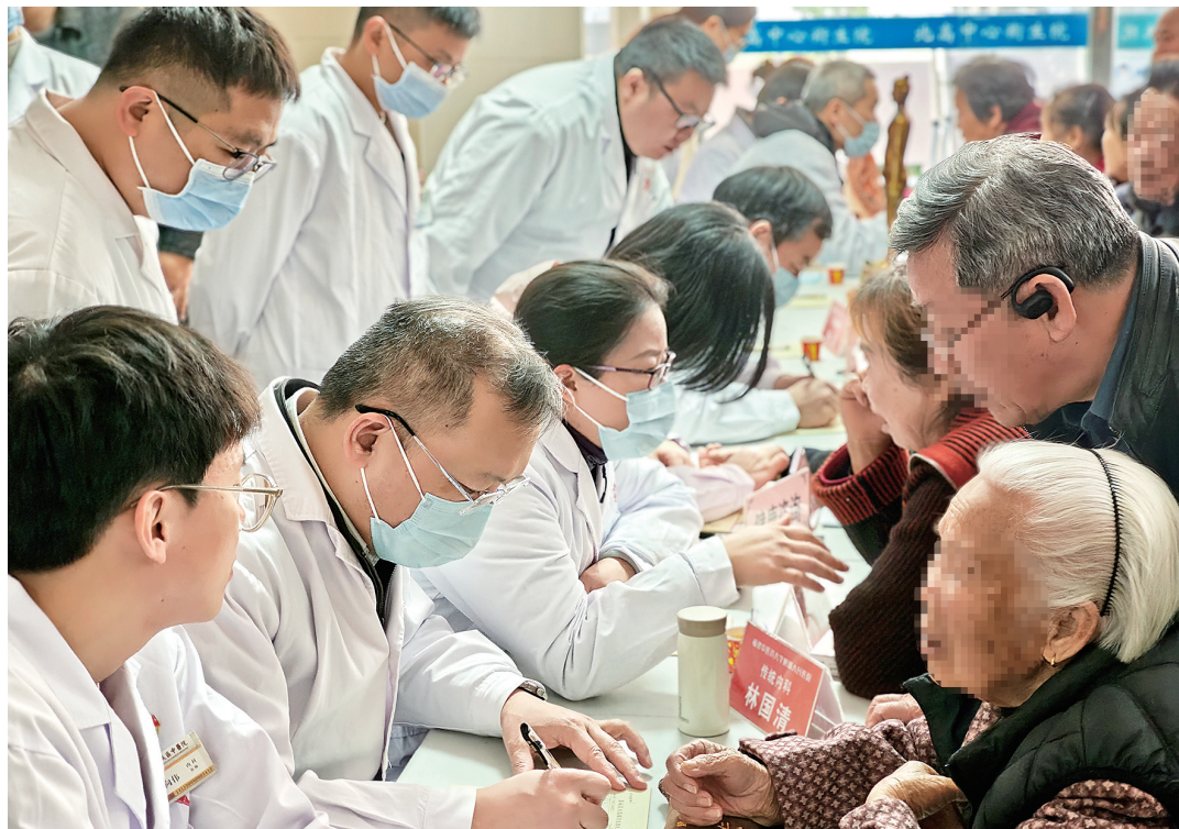
省级专家下沉北高镇卫生院开展义诊活动。

在镇海社区卫生服务中心试点经验的基础上,荔城区卫健局计划2026年在全区推广“家医通”模式,覆盖中心城区与偏远村居,重点打造1—2个村居标杆服务站,让偏远地区群众也能享受均等化智慧医疗服务。