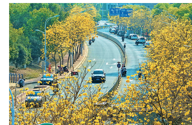
春日,市区滨溪北路黄花风铃木竞相绽放,金黄花海与葱郁林木,整洁道路相映成趣,尽显城市生态之美。

下一步,该局将持续紧盯水质提升目标,加快剩余区域排查,常态化开展“回头看”,坚决防止问题反弹回潮,以系统治理、源头治理、科学治理全力守护木兰溪碧水清流,不断提升人民群众生态环境获得感、幸福感。(陈颖 林雪萍 陈松毅)