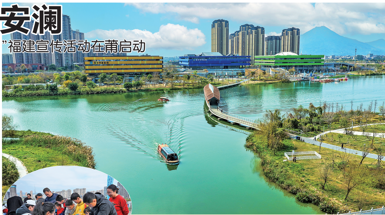
▲图为市民乘坐“水上巴士”,游览绿心美景。

当天,与会嘉宾乘坐“水上巴士”调研玉湖至北大码头河湖水系连通成果,实地察看延寿溪幸福河湖研学基地。市民群众积极参与节水闯关、环湖寻宝打卡、节水知识问答、水利拼图挑战、“污水净化”