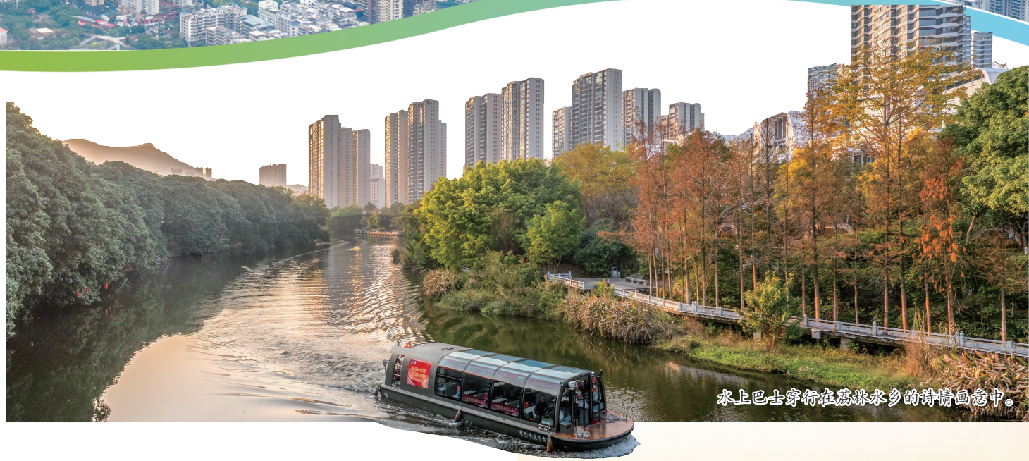
水上巴士穿行在荔枝水乡的诗情画意中。

夜色铺陈,木兰溪夜景流光溢彩,灯火映照碧波潺潺,水上巴士载着欢声笑语缓缓穿行,与玉湖片区的美丽景致交相辉映;莆阳福道蜿蜒绵长,木兰十里风光带一步一景皆诗意;入海口处,红树林成为海岸的生态屏障,黑脸琵鹭在此翩跹栖息,勾勒出人与自然和谐共生的灵动画面。 宜居底色之上,产业之花灼灼绽放。英博雪津以绿色生产践行使命,打造全球领先的智慧工厂;“专精特新”产业园集聚创新力量,培育新质生产力;罗屿铁矿石码头智能化运转,港铁联运高效联通内外,构建起通江达海的物流枢纽,让宜业之路越走越宽。 一溪润莆阳,政绩照初心。木兰溪这条莆田的“母亲河”,承载着世人们的期盼,更镌刻着践行正确政绩观的生动实践,以民为本、久久为功,让昔日水患之河蝶变为兼具生态之美、产业之兴、生活之乐的幸福之河。 一溪清水,见证初心使命,满目风光,书写实干担当。以宜居为基、以宜业为要、以宜游为韵,莆田正向新而行、向美而生。