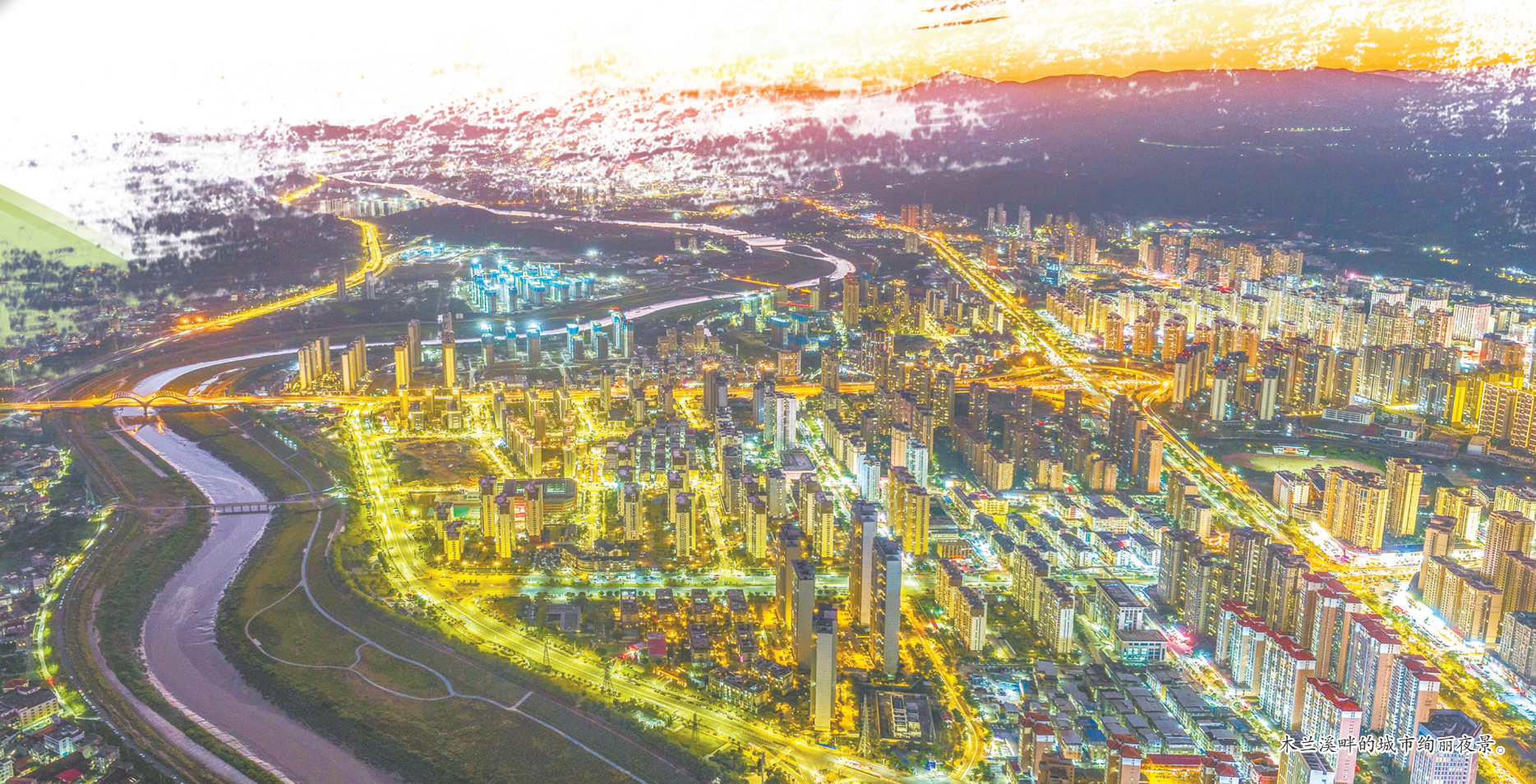
木兰溪畔的城市绚丽夜景。