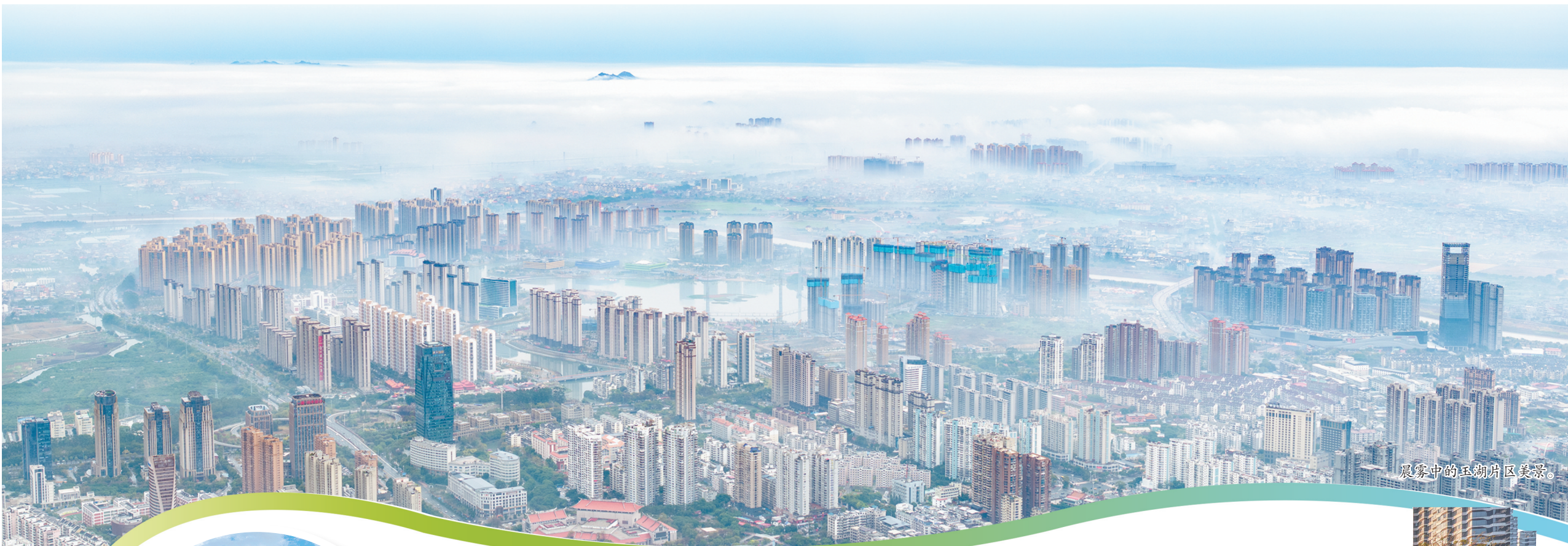
晨雾中的玉湖片区美景。