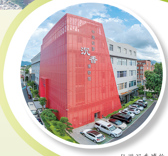
仙游沉香博物馆香飘四海。