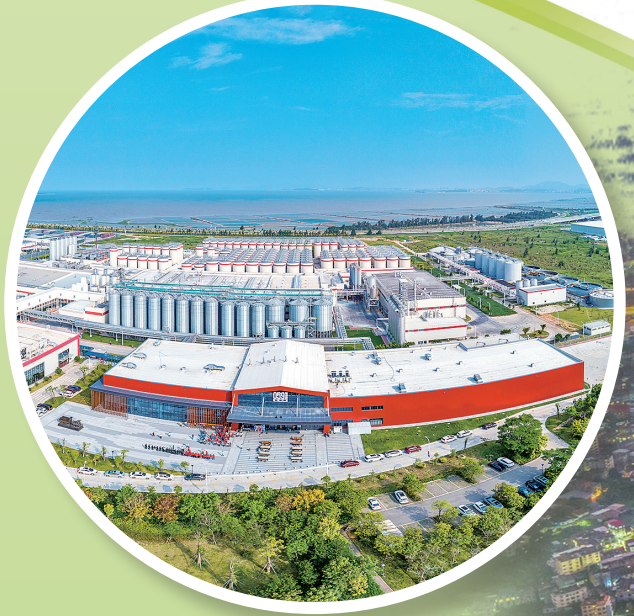
英博雪津打造智慧工厂。