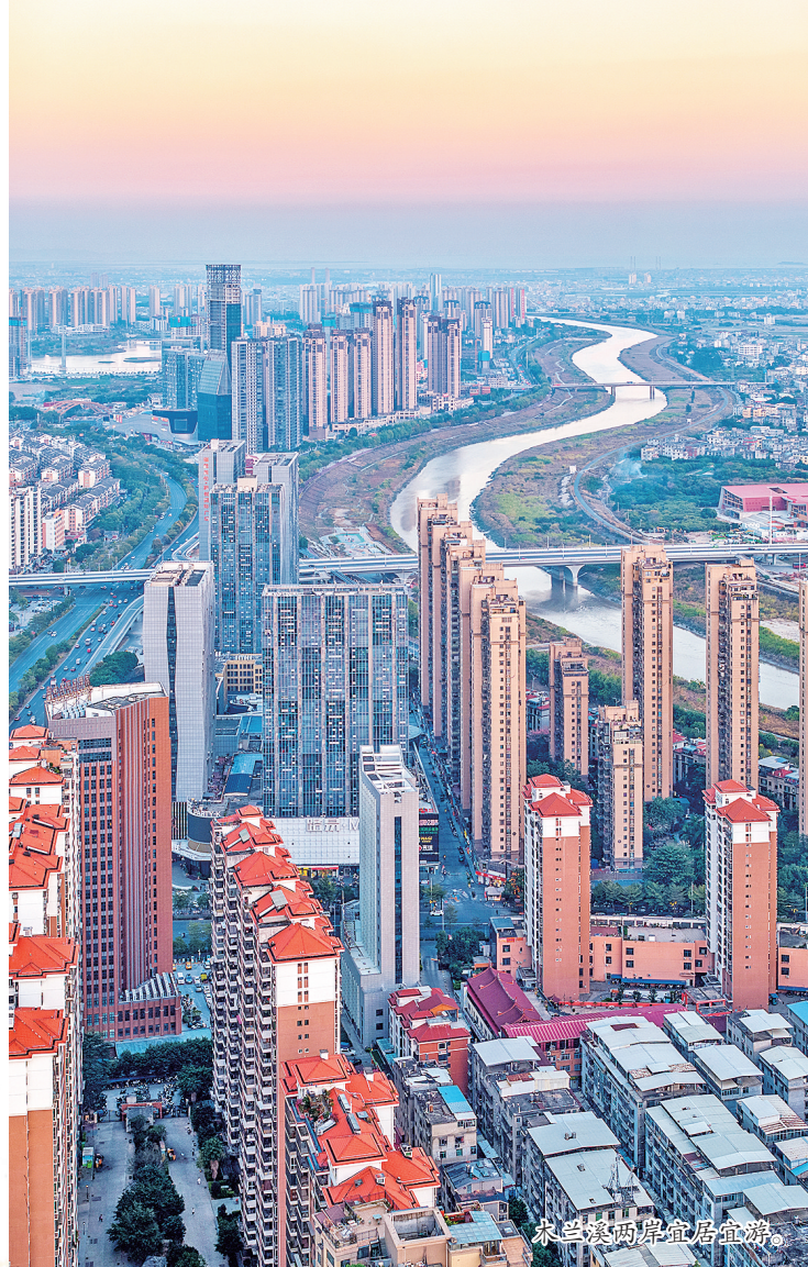
木兰溪两岸宜居宜游。