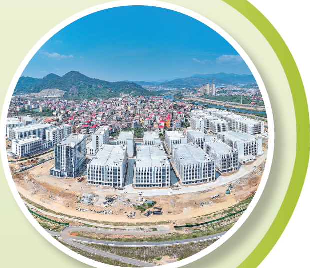
木兰溪边的“专精特新”产业园正拔地而起。