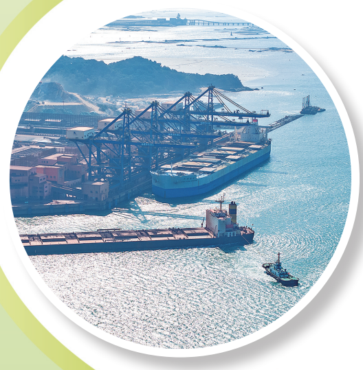
繁忙的罗屿铁矿石码头。