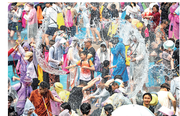
4月15日,人们在泼水广场参加泼水狂欢活动。4月15日,云南省西双版纳傣族自治州迎来一年一度的泼水狂欢活动。各族群众与八方游客齐聚泼水广场,在水花飞溅中共庆泼水节。

中国人民银行、国家外汇管理局有关部门负责人表示,政策调整后,境内银行应遵循依法合规、审慎经营、风险可控原则,开展相关业务,进一步完善内控制度和业务操作规程,与境外银行通过合同约定等形式,明确资金使用条件,有效防范风险。