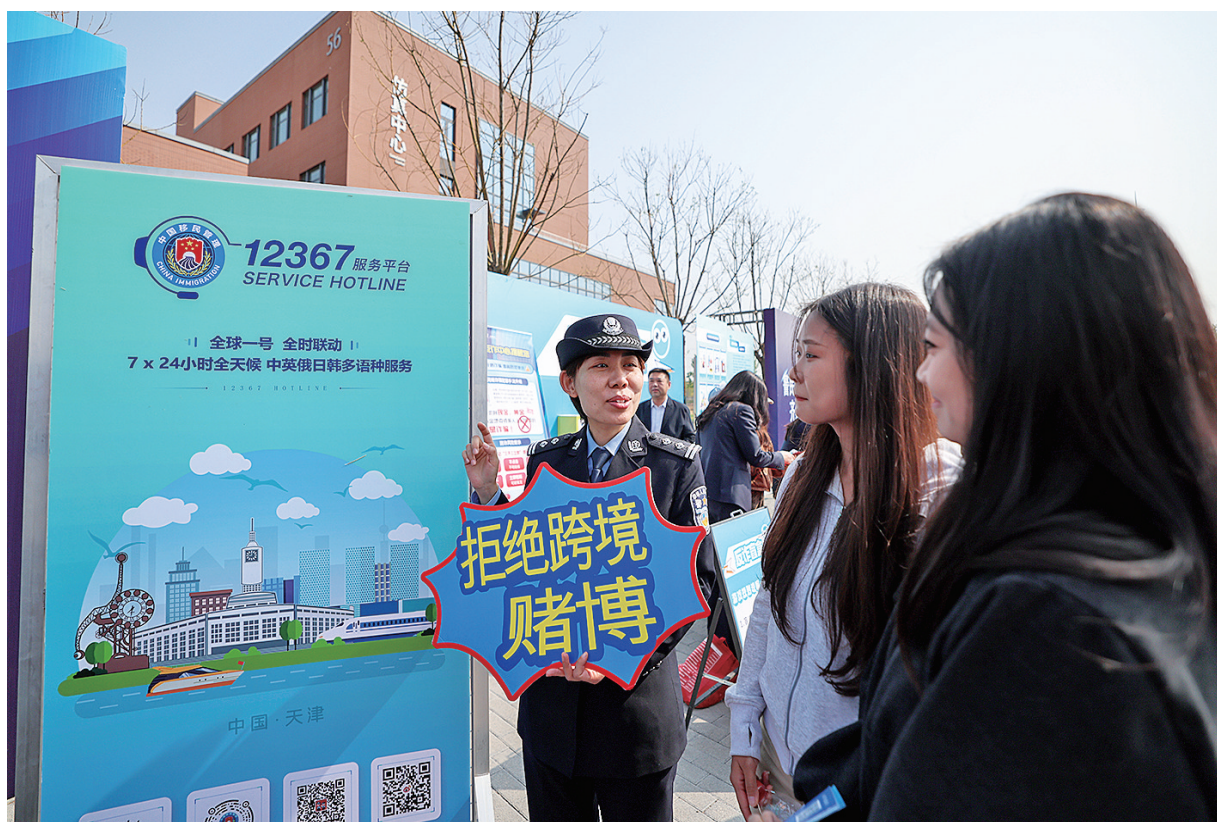
4月15日,在天津大学北洋校区,天津市公安局出入境管理总队民警为学生科普出入境安全知识。4月15日是第十一个全民国家安全教育日。各地开展形式多样的主题宣传教育活动,提高人们的安全意识,共筑国家安全防线。

据悉,“国家安全 青春挺膺”主题团日活动周由共青团中央、国家安全部共同发起,至今已连续开展3年。活动覆盖全国数百万个基层团组织,吸引数千万人次团员青年参与,教育引导广大团员青年有效提升国家安全意识和素养。