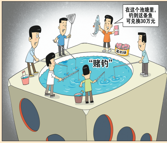
●“赌约” 郑倩 作