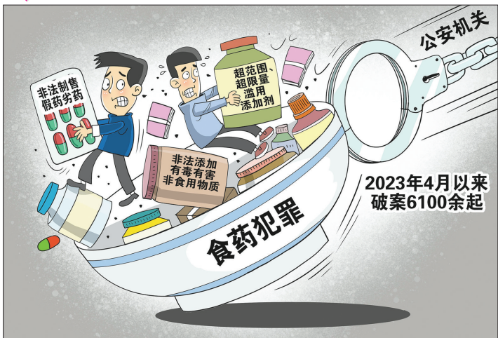
●严打食药犯罪 朱慧卿 作