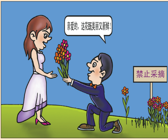
●“彩礼” 乔维 作