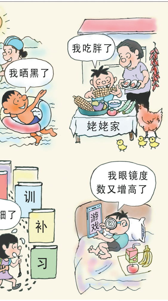
●暑假里 于海林 作