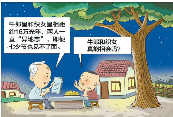
●“异地恋” 且亭 作