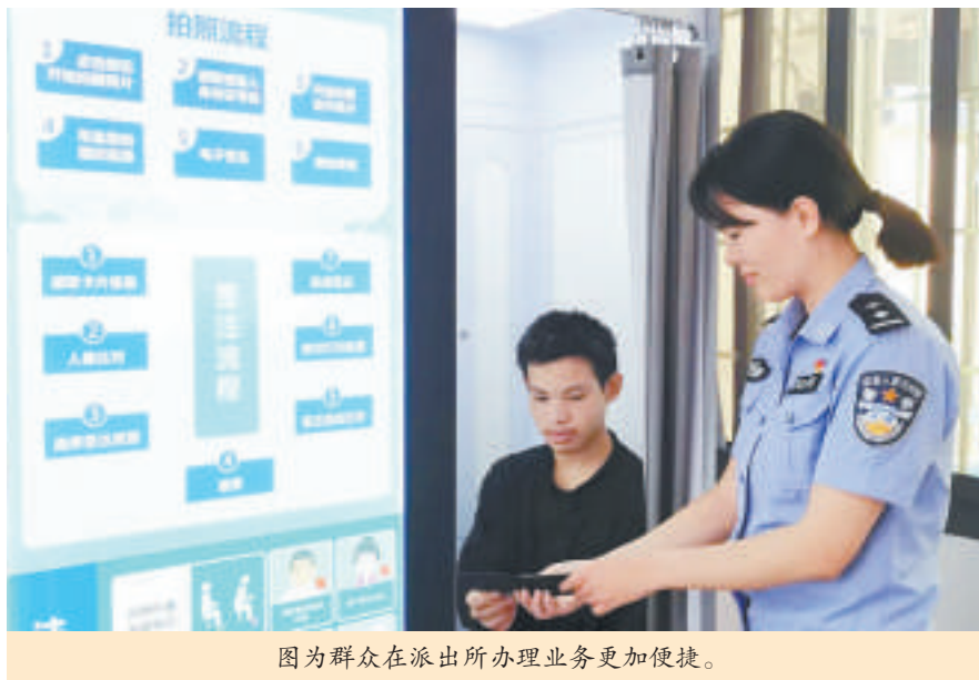
图为群众在派出所办理业务更加便捷。

11月20日一大早,城厢区筱塘小学门口,2名着装整齐的民警开始早高峰护学工作。这是市公安局机关民警主动下沉支援“护校安园”的一个缩影。 校园安全事关千家万户幸福安宁,事关社会大局和谐稳定。市公安局将维护校园安全作为“保民安、护民生、得民心”工程,在深入调研基础上,建立机关民警增援“护学岗”高峰勤务工作机制,即在上下学高峰时段,组织市、县(区)机关民警下沉支援,有力维护校园周边治安、道路交通秩序,有效防范涉校涉生违法犯罪和交通事故,倾力打造全新升级版的校园“护学岗”。 市公安局治安支队副支队长林荣容表示,建立机关民警增援“护学岗”高峰勤务工作机制,参与“护校安园”工作,夯实了平安建设基础。截至目前,共有586名机