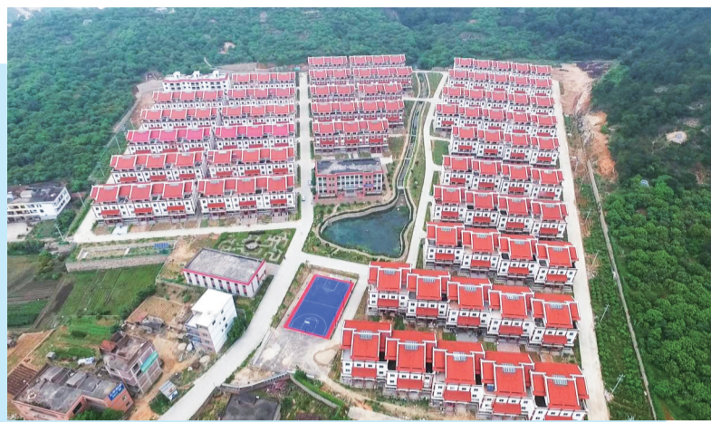
图为莆田农商银行助力打造“幸福家园”

做好绿色金融大文章是生态文明建设的需要,也是金融助力“双碳”目标的重要抓手。莆田农商银行立足支农支小服务理念,秉承“有为农商、实干兴行”理念,全力走好“小而美”的绿色普惠金融发展之路,为木兰溪流域绿色高质量发展贡献农商力量。