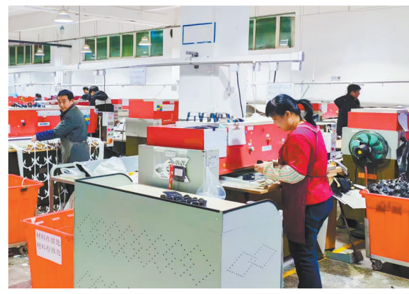
图为东方猎狼服装织造有限公司繁忙的生产车间。

部门联动协作,企业迅速行动。福建东瑞制药有限公司正月初五就全面复工复产,复工率达100%;福建华隆机械有限公司研发投入的高端装备产品七轴机器人和数控超细多组线切割机,订单得到较好的增长,上半年的订单都签约完成;东方猎狼服装织造有限公司工厂为了激励员工及时返岗,出台了包括车费补贴在内的奖补政策等,目前公司到6月份的生产订单都已经接满。 (何晋生 陈志华 陈绍杰 文/图)