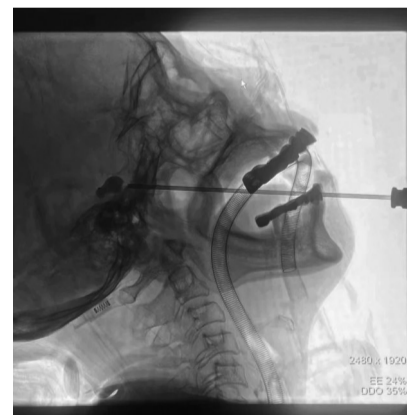
三叉神经球囊压迫术