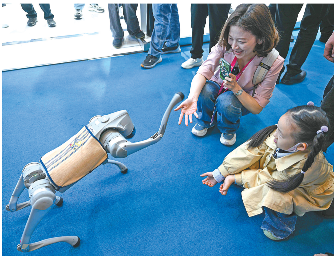
4月14日，观众在第五届消博会宇树科技展台与机器狗握手。第五届中国国际消费品博览会聚焦未来科技，各式各样的机器人纷纷亮相，以前沿科技实力与创新应用，勾勒出未来生活的全新图景。