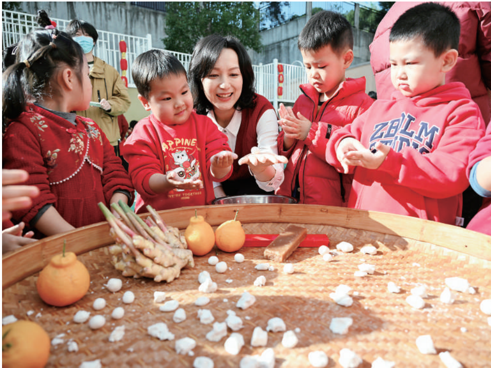
12月16日,城厢区第一实验幼儿园开展“暖冬劳动绘团圆,创意汤圆话成长”冬至主题劳动实践活动,孩子们在亲身体验中锻炼了动手能力,提升了协作意识,感受莆仙传统民俗中蕴含的劳动智慧与文化温情。该幼儿园秉持“文化育人,劳育润心”核心理念,系统推进劳动教育,让劳动习惯自然扎根于幼儿行为之中。

公安视线 本报讯(全媒体记者 吴琪娜 通讯员 苏辉政)记者昨日从市公安局获悉,连日来,我市发生多起“拉车门”盗取车内财物案件。犯罪分子通过随机拉拽车门方式,对未上锁车辆实施盗窃。警方提醒广大车主,务必加强防范,确保财产安全。 11月25日凌晨,嫌疑人唐某、彭某于城厢区一安置房附近通过一辆辆拉车门的方式,盗走车内现金700元,龙桥派出所于次日抓获嫌疑人。11月26日凌晨3时许,嫌疑人陈某趁夜深人静时,在仙游县某小区后门,“拉车门”盗走车主严先生车内2760元现金及香烟8包。目前,陈某已被鲤城派出所抓获。11月30日,嫌疑人林某与一名同伙在涵江区夜间沿街“拉车门”盗走1450元,国欢派出所当日将二人抓获。 据介绍,此类案件多发生于深夜。有些车主图方便,随意将车辆停放在主干道路边、各类商业服务场所门口等监控盲区或车辆密集停放区域,不法分子通过随机“拉车门”方式寻找未锁车辆,伺机盗取车内贵重物品。 警方提醒广大车主下车牢记锁门窗,并手动确认车门已锁好,避免出现“锁而不实”的情况。不要在车内留下现金首饰、手机钱包、名贵烟酒等贵重财物,以免犯罪分子见“财”起意。