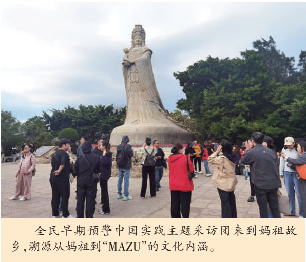
全民早期预警中国实践主题采访团来到妈祖故乡,溯源从妈祖到“MAZU”的文化内涵。

12月初,在重庆举行的2025年中欧班列商贸物流气象服务联合年会上,发布“妈祖(MAZU)”全民早期预警中欧班列商品运输安全气象风险产品。 该产品由浙江、重庆、连云港、新疆等地气象部门依托中国气象局“妈祖(MAZU)”全民早期预警体系共同研发,除提供天气实况和45天预报等基础服务外,还聚焦进出口生鲜、精密仪器等10余种气象高敏感商品,量身打造了“一货一策”的风险预警模型,并推出灾害天气风险提示、商品专属运输日历等特色产品,初步实现了对中欧班列“实时监测+精准预报+风险预警+联动响应”的全流程服务功能。 妈祖观天象、识潮音,救海难、护平安。每年公历3月23日为世界气象日,农历三月廿三则是妈祖诞辰日。这一时间上的巧合,也呼应着文化传承与科技使命之间的内在联系。 今年是联合国“全民早期预警”倡议深入推进的关键之年,也是全民早期预警中国方案“妈祖(MAZU)”走向世界的启航时刻。 今年7月,中国气象局在2025年世界人工智能大会开幕式上发布全民早期预警中国方案“妈祖(MAZU)”。在世界气象组织秘书长席列斯特·绍罗和与会嘉宾的见证下,中国气象局局长陈振林将象征城市多灾种早期预警智能体的“AI气象预警钥匙”交给吉布提、蒙古两国代表,城市多灾种早期预警智能体(MAZU-Urban)开启跨国气象防灾减灾使命。 记者了解到,Mazu-Urban能通过简单的聊天界面提供风险评估、实时监测、预报、自动灾害报告和人工智能生