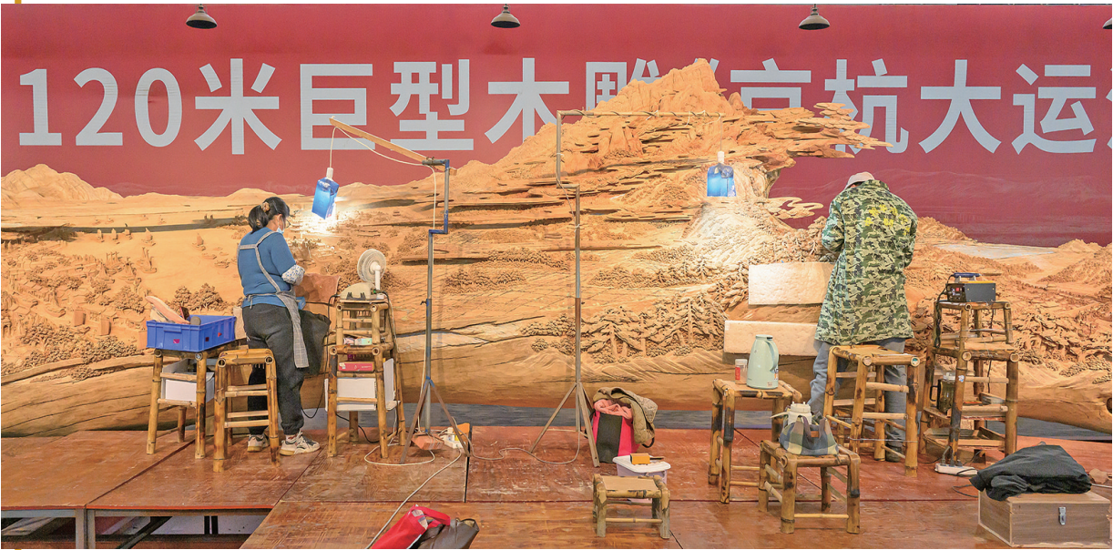
京杭大运河济宁段正在创作中