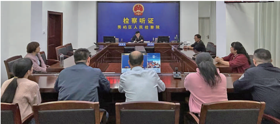
图为秀屿区检察院以检察听证回应群众期盼、守护社会和谐。

面对群众“和解是不是花钱买刑”“为什么别人能不诉我我却不能”的疑虑,秀屿区人民检察院严格落实“应听证尽听证”要