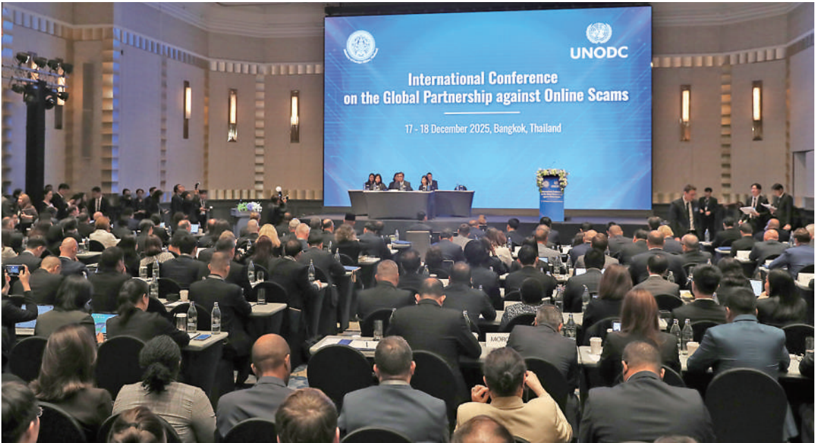
全球打击网络诈骗伙伴关系国际会议17日至18日在泰国曼谷召开,会议旨在呼吁国际社会加速采取协调一致的行动,共同应对日益严重的网络诈骗犯罪问题。