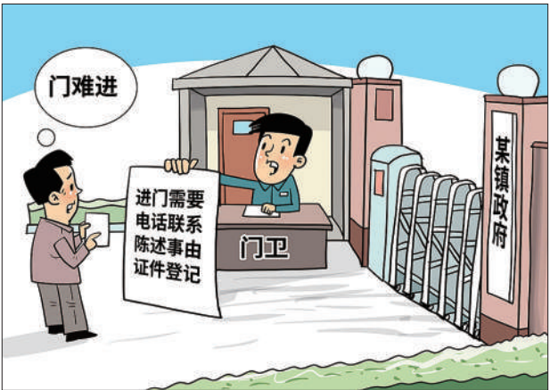
●群众没有事就不能进镇政府大院？