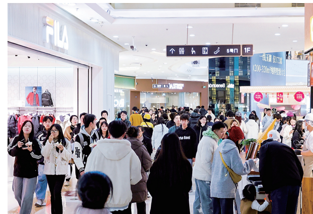
城厢区以首店经济聚人气，万达广场客流不断。

首店引潮聚人气，IP场景强根基，场景焕新增活力。城厢区以“三新”消费引擎为有力抓手，成功解锁多元消费新体验，让商业烟火气持续升腾、新经济活力充分迸发，让“和美莆田、共同富裕”首善之区的商业名片愈发亮眼，在消费高质量发展的赛道上续写精彩篇章。