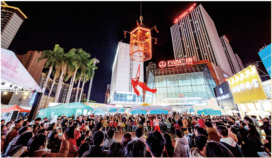
元旦假期，城厢区丰富多彩的活动点燃了大众消费热情。