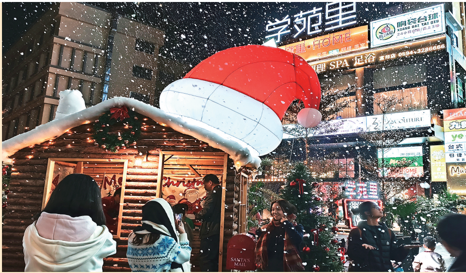
学苑里文创园打造年轻人喜爱的潮流地。

2025年以来，城厢区聚焦消费新业态、新模式、新场景培育，以首店经济聚势、IP跨界铸魂、场景创新赋能，激活消费活力，为首善之区建设注入强劲动能。