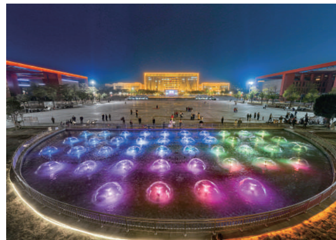
仙游县引水入城修复市民广场水系。