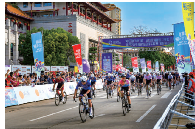
福建省自行车联赛揭幕赛成功举办。