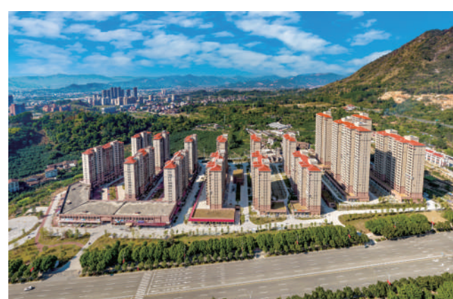
蓝山安置房二期项目回迁交付。