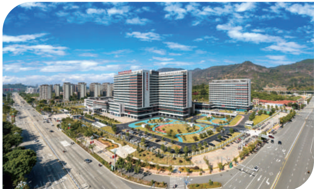
仙游县总医院新院区搬迁投用。