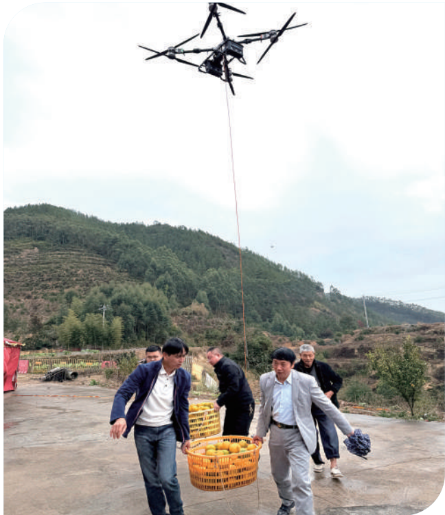
普航无人机运营中心落地。