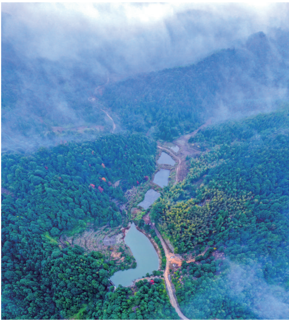
木兰溪源头山清水秀。