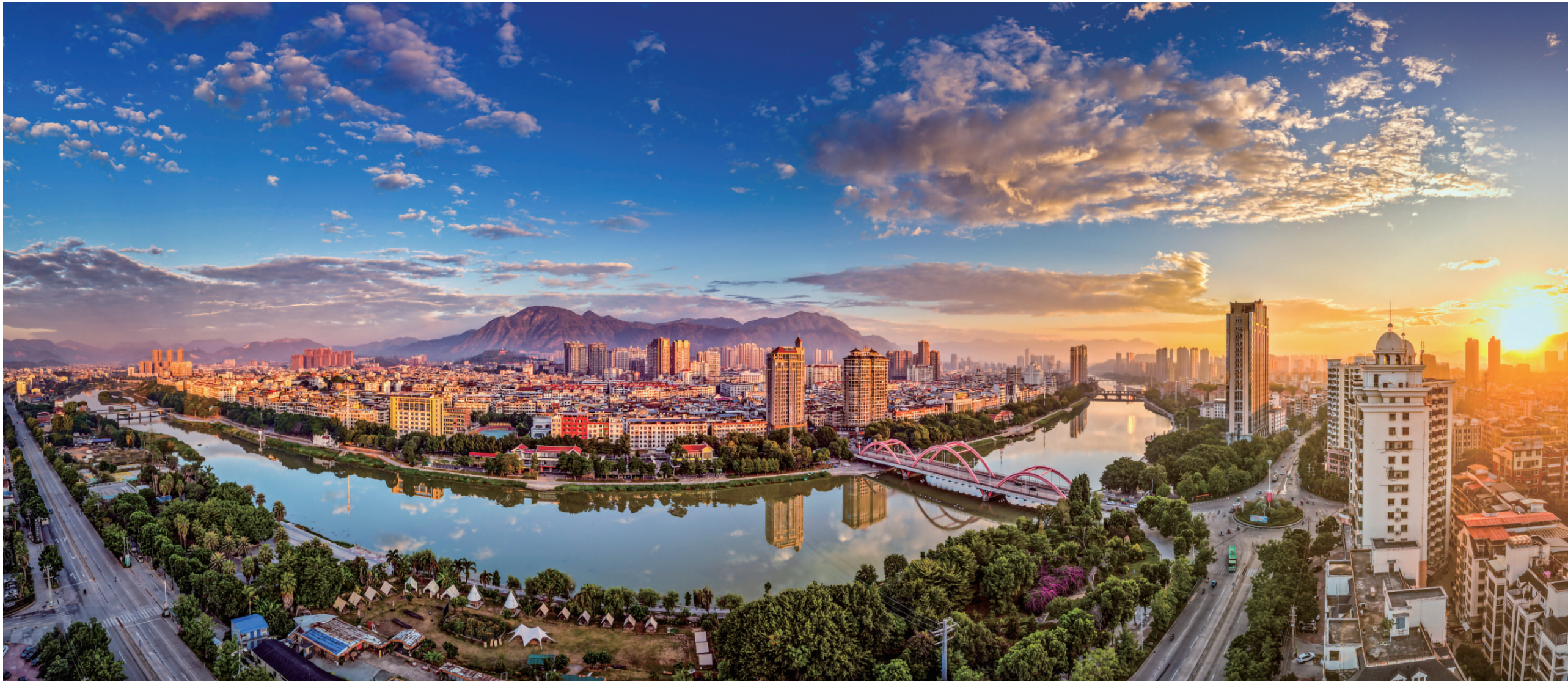
城乡环境日新月异。