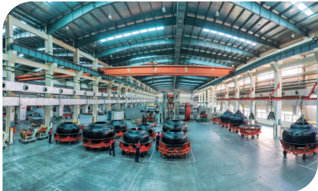
海安集团成为全省首家深圳主板上市企业。

“十五五”期间,仙游将紧扣“和美仙游、共同富裕”目标,以木兰溪综合治理为总抓手,聚力打造绿色智造创新县、城乡融合品质县、全域旅游特色县、千年古县文化名城。坚持以绿色高质量发展为主线,以改革为动力,以民生为根本,奋力推动经济提质增量、人民共同富裕,奋勇争先谱写中国式现代化仙游实践新篇章。