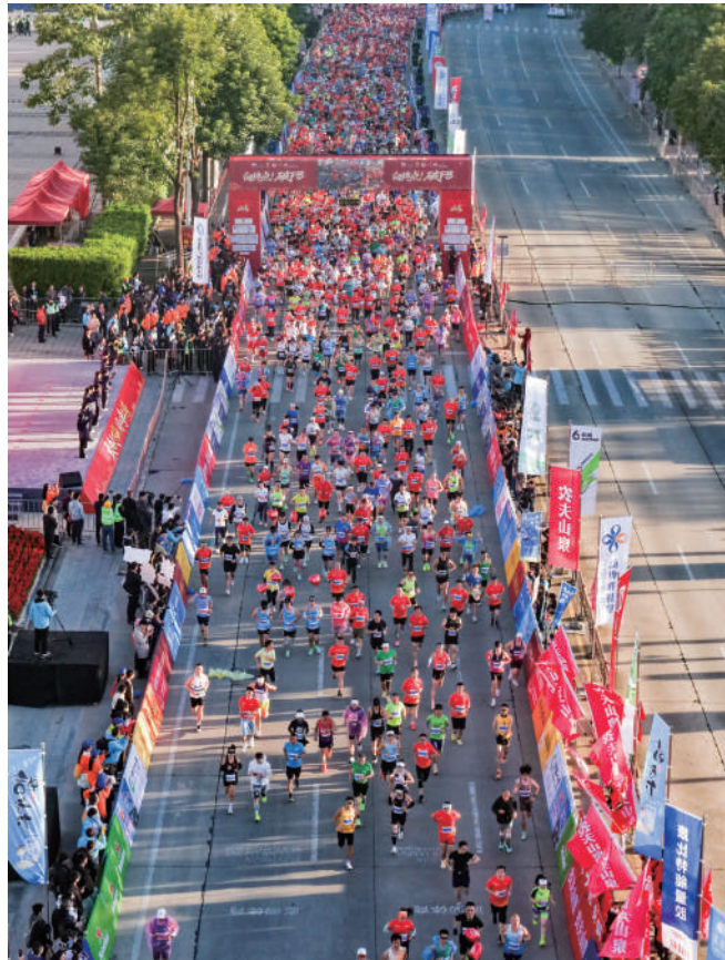
2025仙游马拉松赛事火热。