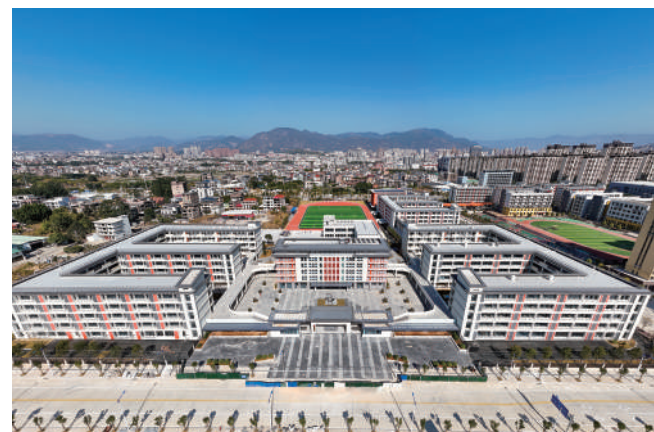
福师大仙游附属学校二期工程竣工投用。