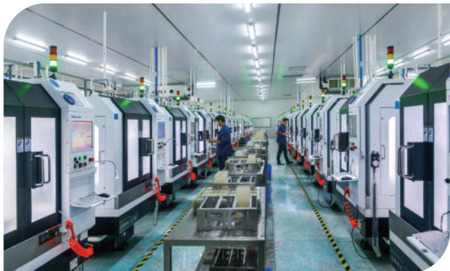
鑫瑞新材料生产车间有序运转。