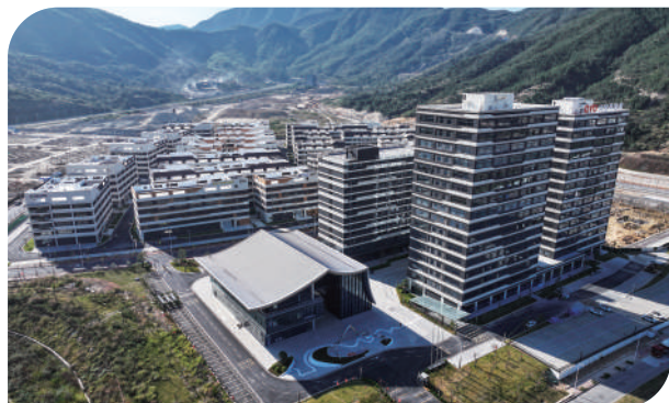
中电科创建设招商并举。