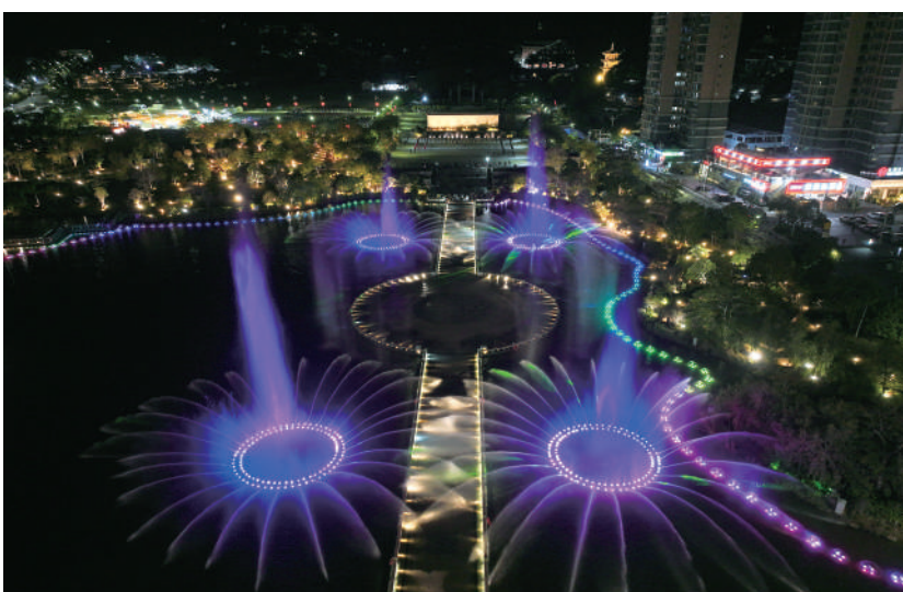
南湖公园喷泉夜景成打卡地标。