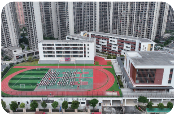
南门学校木兰校区投用。