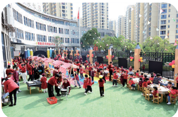
圳湖社区老少其乐融融迎新年。