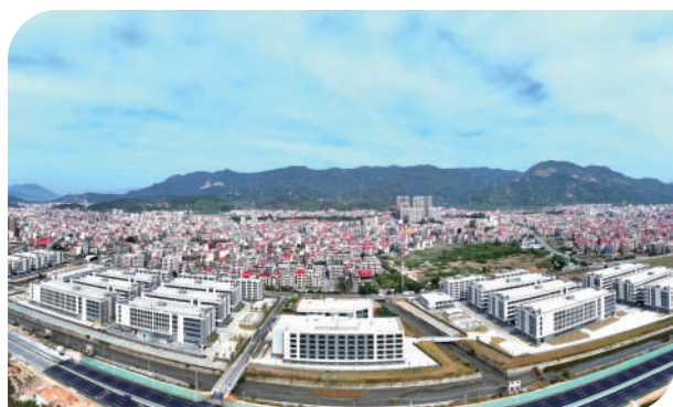
东海鞋服科技产业园投产赋能。