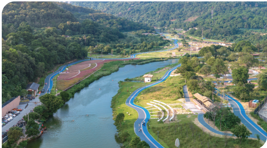
洒华郊野公园推窗见绿。