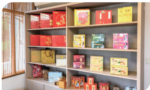
“天桂”桂圆干入选外交部伴手礼。