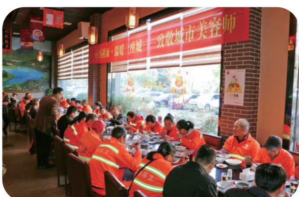
举办“一碗妈祖面·温暖一座城——致敬城市美容师”关爱活动。