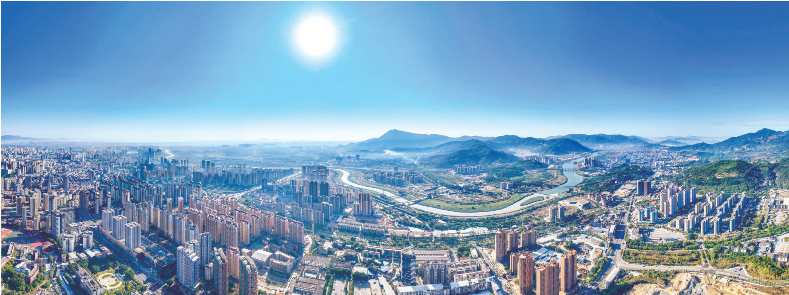
首善城厢蒸蒸日上。

站在新的历史交汇点，奋斗使命催人奋进。城厢区立足“十四五”发展积淀的坚实基础，锚定“十五五”发展的更高目标，以打造“和美莆田、共同富裕”首善之区为使命，谋定而动、乘势而上，精心擘画经济社会高质量发展的崭新蓝图。2026年作为“十五五”规划的开局之年、奠基之年，该区将聚焦项目攻坚、产业升级、城市提质、生态保护、改革开放、民生改善等重点领域，以“功成不必在我”的境界和“功成必定有我”的担当实干笃行，奋力开启新的征程。