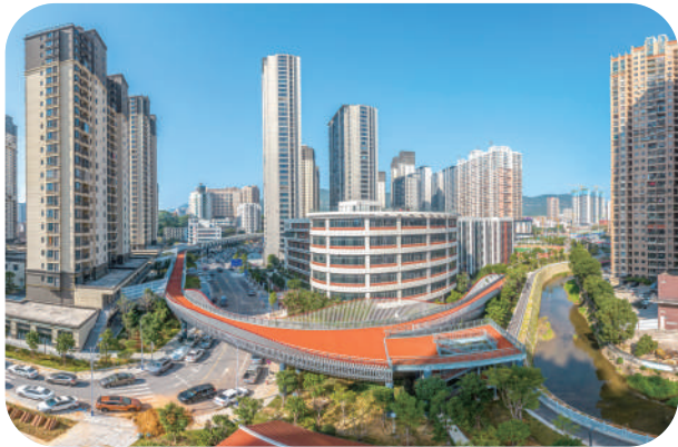
龙德井片区改造提升城市宜居品质。