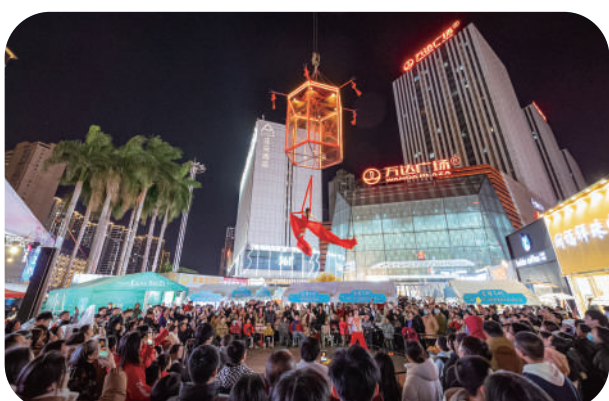
万达广场商圈人气爆棚。