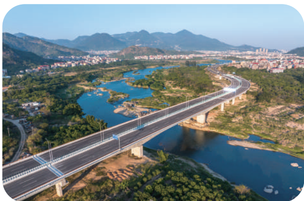
木兰大道顺利通车。