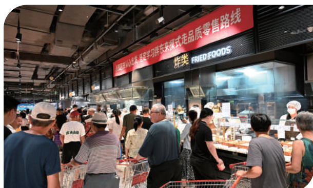
永辉超市“胖改”焕新开业。

过去5年，是城厢区栉风沐雨、经受重大考验的5年，更是逆势上扬、实现跨越发展的5年。5年来，全区上下同心同德、凝心聚力，以“逢山开路、遇水架桥”的闯劲和“踏石留印、抓铁有痕”的干劲，有效应对各类风险挑战，推动经济社会发展跃上新台阶、开创新局面，向全区人民交出了一份沉甸甸、亮堂堂的“十四五”收官答卷。