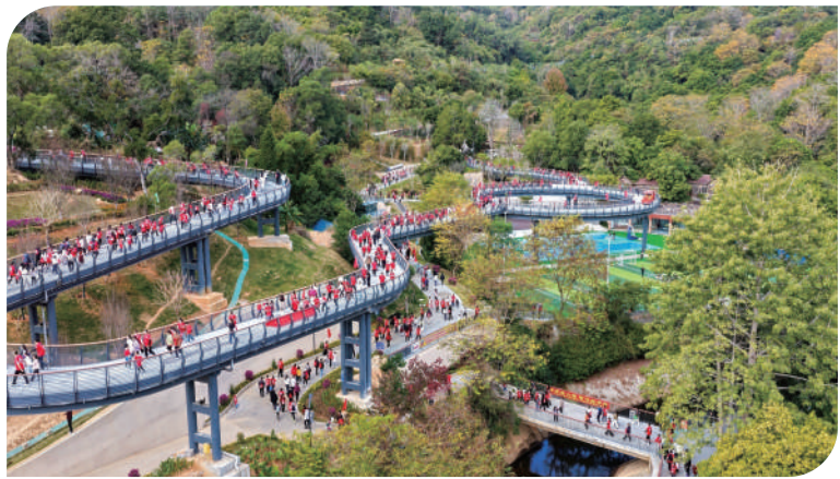
莆阳福道铺就家门口的“幸福路”。