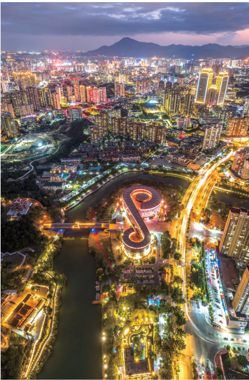
城市夜景流光溢彩。

安全底线更加牢固。食品安全工作得到国务院食安委表彰肯定；有效应对超强台风“杜苏芮”“苏拉”等极端天气，人民群众生命财产安全得到有力保障。风险防范更加严实，有力处置化解不良贷款、“保交楼”“保交保”项目全面交付，群众安全感持续提升，获得感成色更足，为经济社会发展营造了安全稳定的良好环境。