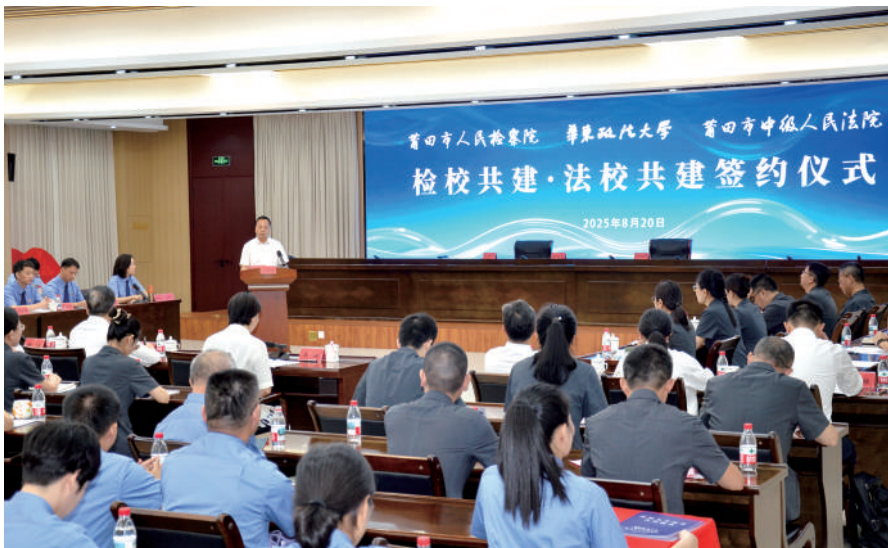
莆田中院与华东政法大学举行法校共建签约仪式。