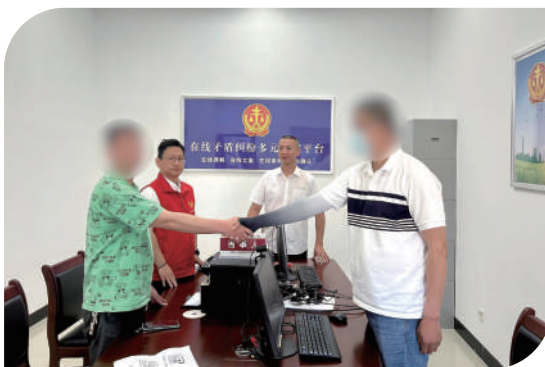
仙游法院通过“总对总”诉调对接机制成功调解一起涉残疾人纠纷案件。

同时，知识产权司法保护力度持续加大。面对抢注老字号商标、仿冒鞋设计等侵权行为，法院坚决亮剑，全年审结知识产权民事案件4539件。通过推行要素式审判、示范判决等机制，约85%的知识产权民事纠纷在起诉后一个月内得到解决，以高效司法守护创新火种。数据显示，假冒注册商标犯罪案件同比下降35.6%，自主创新氛围愈发浓厚。