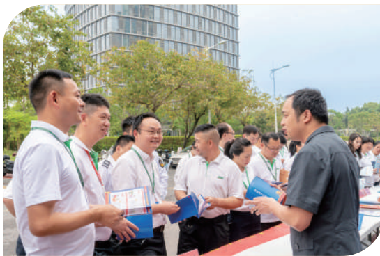
荔城法院开展劳动者权益保护专题普法活动。

既解法结，也解心结。莆田法院注重发挥司法裁判的价值引领作用，将社会主义核心价值观融入审判全过程。全年开展巡回审判157场次，把法庭搬到田间地头、社区村落；深入机关、企业、学校开展普法宣讲256场次，通过一个个鲜活的案例，明确“醉酒驾驶”不免刑责、家庭监控不得侵犯他人隐私等行为准则，用公正司法弘扬法治文明新风尚。