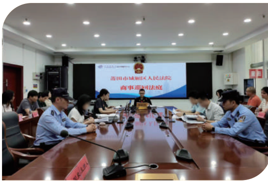
城厢法院在莆田市贸促会通过商事巡回法庭，公开审理一起商标权纠纷案件。