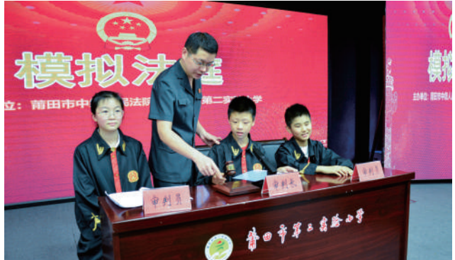
莆田中院开展“法润幼苗 助力成长”模拟法庭活动。