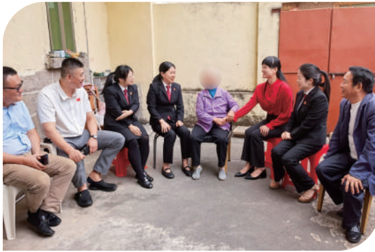
涵江法院开展重阳节特别“家访”，发出全市首份《关爱老年人提示卡》。