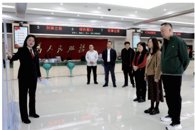
莆田法院举办人大代表、政协委员专场法院开放日活动。