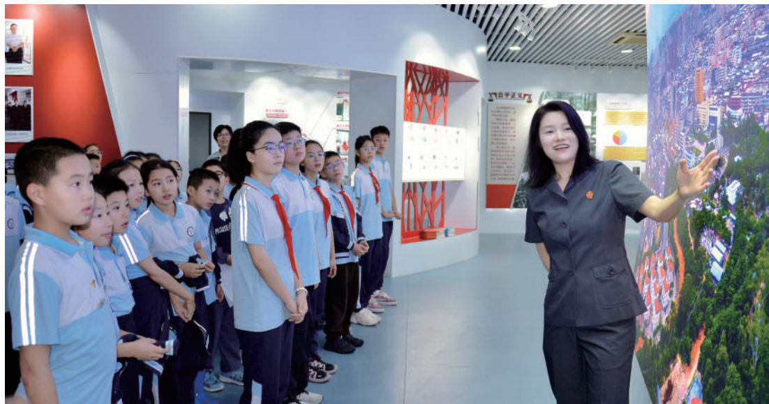
莆田中院举办未成年人普法宣传活动。