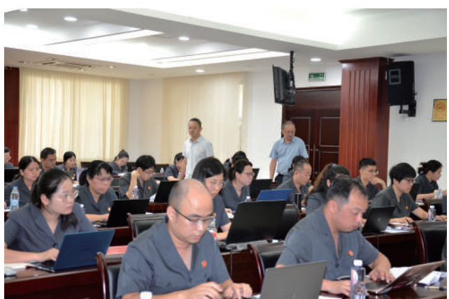
莆田中院组织开展全市法院民事法官技能竞赛。

法润莆阳，初心如炬；司法为民，步履不停。站在新的时间节点，莆田法院将继续坚守为民初心、践行司法使命，以更坚定的担当、更务实的举措、更优质的服务，为莆田经济社会高质量发展提供更加有力的司法保障，努力让人民群众在每一个司法案件中感受到公平正义，在新的赶考路上书写更加优异的司法答卷！