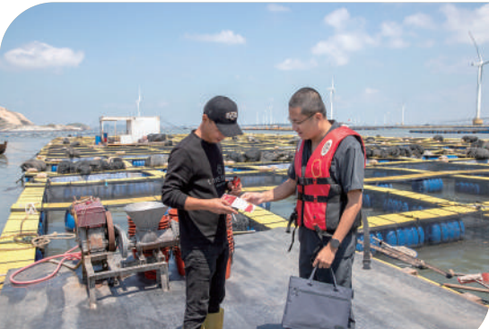
秀屿法院深入南日岛海上养殖区、渔港码头开展专项普法活动。