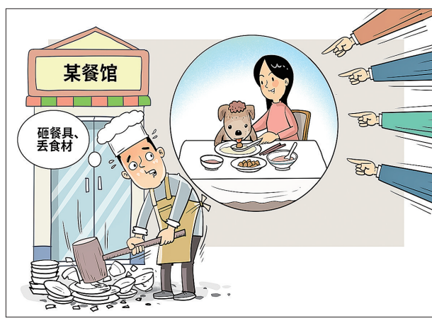
●别让老板再砸盘子！这对“公共餐具喂狗”出手了 咩咩 作