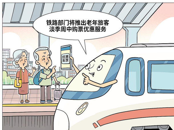
●购票优惠服务 朱慧卿 作