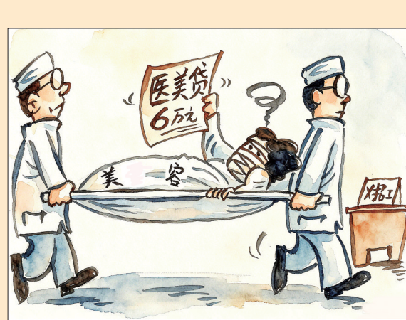
●为了找工作 韦荣景 作