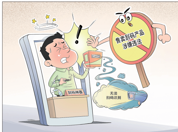
●叫停“扫码”之手 王琪 作