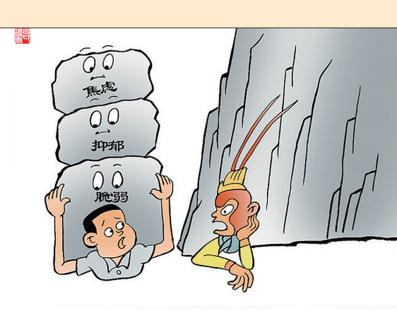
●悟空新邻 么艺 作